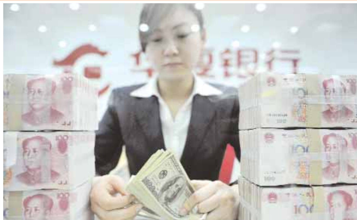
■ موظفة تقوم بعد أوراق بكنوت من الدولارات الأميركية بأحد فرع بنك هواكسيا بمقاطعة لياونينج أس. وقد أعلنت مجموعة تجارية شبه رسمية أن رفع قيمة اليوان ستمثل كارثة على الصادرات الصينية المتكررة على الأيدي العاملة. ويجري المجلس الصيني لترويج التجارة الدولية مراجعات مع أكثر من ألف من المصدرين في ١٢ صناعة لمعرفة مدى قدرتهم على مسايرة سعر صرف أكثر قوة. رويترز

■ سيئول - د.ب.أ: أعدمت كوريا الشمالية مسئولاً مالياً مسئولاً عن عمليات تغيير سعر صرف العملة التي تمت في نوفمبر الماضي. ونقلت وكالة يونهاب الكورية الجنوبية عن عدة مصادر لم تفصح عن هويتها أمس الخميس القول إنه تم الأسبوع الماضي إعدام رمياً بالرصاص باك نام جي الذي فصل من منصبه كمدير إدارة التمويل والتخطيط في حزب العمال الحاكم وذلك في بيونغ يانغ لقيامه "بتخريب الإقتصاد الوطني عن عمد". وذكرت وكالة يونهاب إن باك أطلق المبادرة التي أدت لزعة الاستقرار وتفاقم أزمة نقص الغذاء في كوريا الشمالية وكان يهدف الاقتراح للحد من التضخم ومراقبة الاسواق الخاصة ولكن هذا الاجراء الاصلاحي تسبب في حدوث تضخم كبير وعرض خطة زعيم كوريا الشمالية كيم جونج ايل لتمرير السلطة لابنه الاصغر للخطر. ونقلت يونهاب عن مصدر رفض الافصاح عن هويته القول "حالة القيادة في كوريا الشمالية جعلت باك نام كي كيش فداء". وكانت صحيفة شوشون اليو الكورية الجنوبية ذكرت الشهر الماضي أنه تم إعدام باك نام جي في يناير الماضي. ولم تؤكد وزارة الوحدة الكورية الجنوبية ولا جهاز الاستخبارات الوطني التقارير المتعلقة بإعدام باك.