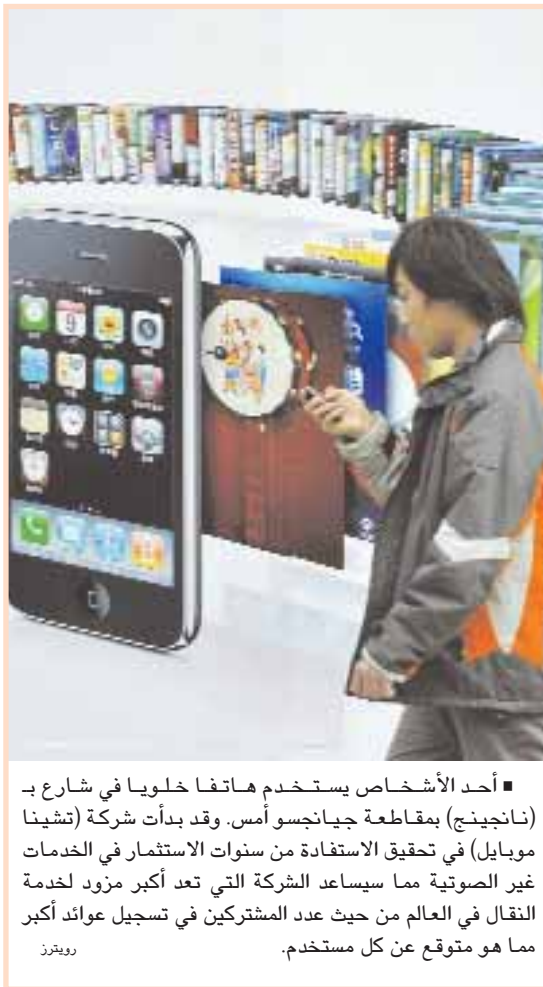
■ أحد الأشخاص يستخدم هاتفها خلويها في شارع بد (نانجينج) بمقاطعة جيانجسو أس. وقد بدأت شركة (تشينا موبايل) في تحقيق الاستفادة من سنوات الاستثمار في الخدمات غير الصوتية مما يساعد الشركة التي تعد أكبر مزود لخدمة النقال في العالم من حيث عدد المشتركين في تسجيل عوائد أكبر مما هو متوقع عن كل مستخدم.

■ سان فرانسيسكو - د.ب.أ: ذكرت تقارير إخبارية أن شركة جوجل لخدمات الإنترنت شكلت تحالفا مع سوني اليابانية وانتل ولوجي تك الأميركية لتطوير تقنية جديدة تساعد مستخدمي التلفزيون في الوصول إلى القنوات التي يريدون مشاهدتها من بين مئات القنوات التي تبثها الأقمار الصناعية. وذكرت صحيفتا "ول ستريت جورنال" و"نيويورك تايمز" الأميركيين أن جوجل التي تدير أشهر محرك بحث على الإنترنت في العالم تأمل أن تؤدي هذه الخطوة إلى نقل توسيع نطاق عملها ليشمل التلفزيون إلى جانب أجهزة الحاسوب والهواتف النقالة. وذكرت التقارير أن خدمة جوجل الجديدة للبحث عن القنوات تعتمد على وجود جهاز يضاف إلى جهاز التلفزيون يستخدم معالجة أتم الموفر للطاقة الذي تنتجه إنتل ونظام التشغيل أندرويد الذي تنتجه جوجل وجهاز التحكم عن بعد تنتجه لوجي تك. وسيكون نظام جوجل جديد مفتوحا بما يتيح لشركات أخرى استخدامه وتطوير برامج تعمل معه كما هو الحال في نظام التشغيل أندرويد. تأمل سوني الياباني في إضافة التقنية الجديدة إلى أجهزة التلفزيون التي تنتجها لمواجهة المنافسة المتزايدة في السوق من جانب شركات مثل سامسونج الكورية الجنوبية وغيرها.