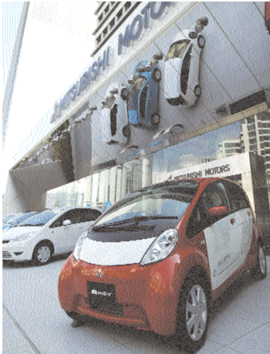
شعار شركة (ميتسوبيشي) للسيارات كما بدا في معرضها بطوكيو، أمس.