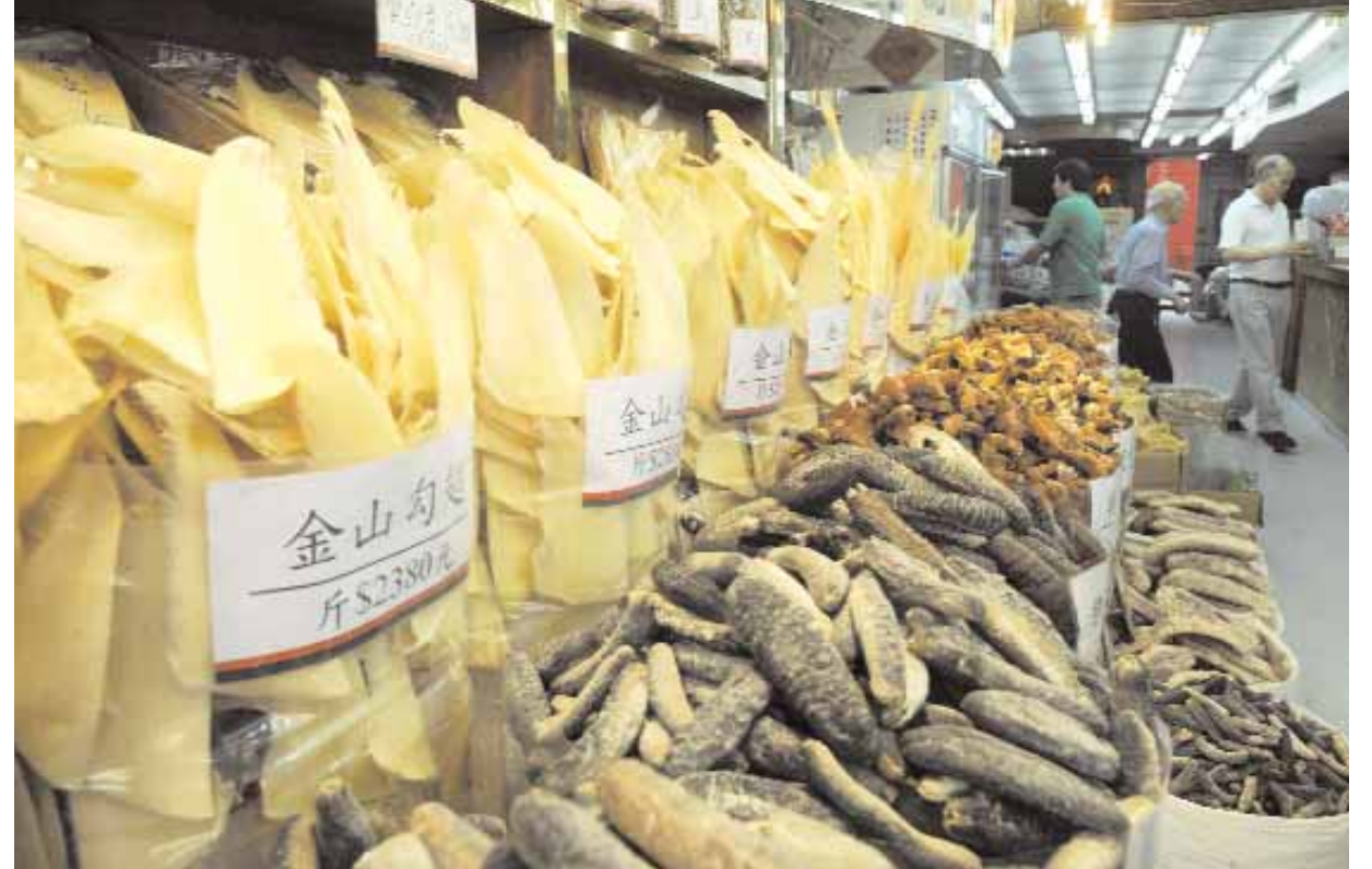
■ زعانف اسماك القرش معروضة للبيع بسوق في هونغ كونغ امس حيث تستخدم زعانف القرش في عمل حساء. ويتكلف طبق حساء زعانف القرش نحو ١٠٠ دولار اميركي فيما يصل سعر الزعنفة الواحدة اكثر من ١٣٠٠ دولار.