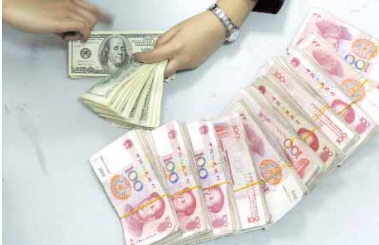
■ موظفة بنك تعد اوراق دولار بجانب كومة اوراق بنكنوت فئة ١٠٠ يوان امس حيث تعمل الولايات المتحدة للضغط على الصين لإعادة تقييم عملتها

■ هامبورج - د.ب.أ: ربما لا يرحب كثير من مستخدمي الشبكة الدولية بفكرة إعطائهم حرية اختيار متصفح الانترنت الذي يريدون استخدامه. وبدأ نظام تشغيل ويندوز من شركة مايكروسوفت يتيح لمستخدميه إمكانية اختيار متصفح الانترنت الذي يريدون استخدامه بدلا من إرغامهم على استخدام برنامج الشهير إكسبلورر اعتبارا من ١٧ مارس الجاري. ورغم أن فكرة حرية الاختيار قد تروق للبعض، إلا أن الأشخاص غير المتمرسين في استخدام التكنولوجيا قد يجدون فكرة الاختيار مزعجة للغاية بالنسبة لهم. ويقول تيم بوسنيك من شركة "سيرفالوس" الألمانية التي تعمل في مجال تقييم المنتجات التكنولوجية "كثير من الأشخاص يستخدمون برامج تصفح الانترنت دون أن يفهمون حقيقتها في واقع الأمر" وحتى وقت قريب للغاية، كان مستخدمو نظام تشغيل ويندوز يرغمون على استخدام المتصفح "إكسبلورر" الذي كان يتم تنزيله تلقائيا على معظم أجهزة الحاسوب الشخصي ويظهر بشكل آلي في صورة حروف "أي" أزرق على شريط الأدوات. أما أي شخص يريد استخدام برنامج متصفح مختلف، فكان يقوم بتنزيله من الانترنت واستعماله حسب رغبته. ولكن الاتحاد الأوروبي أصدر أوامره لشركة مايكروسوفت بصورة أو بأخرى بإتاحة حرية اختيار المتصفح لمستخدميه. وسوف يلاحظ مستخدمو نظام ويندوز تأثير هذا القرار في المرة القادمة التي يقومون فيها بتحديث النظام على الحاسوب الخاص بهم. وتوضح إيرين نادلر المتحدثة باسم شركة مايكروسوفت "سوف تظهر نافذة حوارية بشكل تلقائي عليها خمسة من أشهر برامج التصفح وهي الإصدار الخامس من برنامج