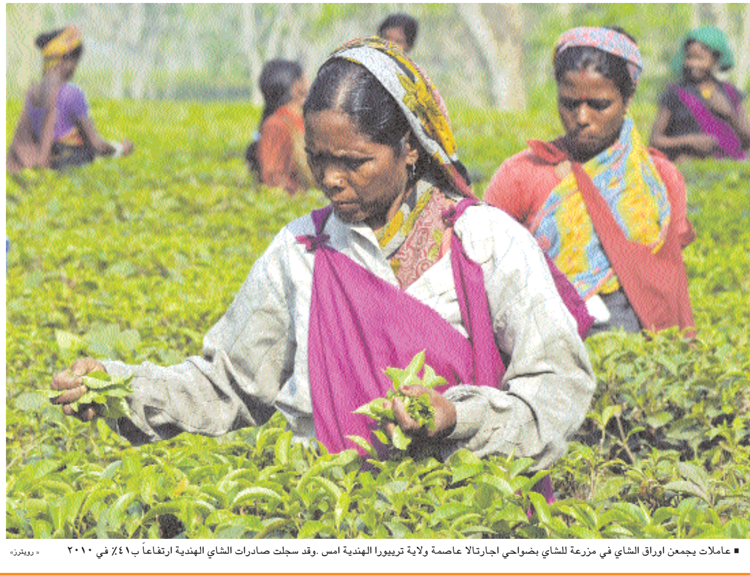
عاملات يجمعن اوراق الشاي في مزرعة للشاي بضواحي اجارتالا عاصمة ولاية تريبورا الهندية امس، وقد سجلت صادرات الشاي الهندية ارتفاعاً بـ ٤١٪ في ٢٠١٠ - رويترز.