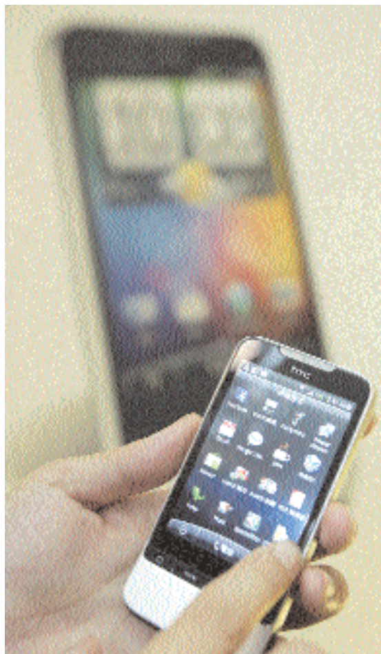
■ الهاتف الذكي الجديد «ليجن» من HTC خلال عرضه في مؤتمر صحفي في تايبي امس ويقدر سعرة بـ ٥٣٠ دولار - رويترز.

■ برلين - د.ب.أ: أوشتت ألمانيا وسويسرا على توقيع اتفاقية لتنظيم مسألة تبادل المعلومات حول المتهربين من الضرائب وهي المسألة التي تسببت مؤخرا في خلافات بين البلدين. وذكرت صحيفة "هاندلسبلات" الألمانية الصادرة امس الاربعاء أن وزيرى الداخلية الألماني فولغانج شويليه ونظيره السويسري هانز رودولف ميرتس سيلتزمان عن الاتفاقية بعد غد الجمعة في برلين. وأضاف تقرير الصحيفة أن مسؤولين من البلدين اجتمعوا في برن الأسبوع الماضي للتفاوض حول الاتفاقية الجديدة التي تنظم مسألة تبادل المعلومات بين البلدين مستقبلا حول المتهربين من الضرائب. وقال المتحدث باسم شويليه إن المفاوضات بشأن الاتفاقية على وشك الانتهاء. يذكر أن سويسرا أقرت استياء ألمانيا مؤخرا بسبب السرية الشديدة التي تفرضها على البيانات البنكية والتي تساهم في حماية متهربين ألمان. ولكن التقرير أوضح أن الاتفاقية الجديدة لن تشمل الحالات القديمة.