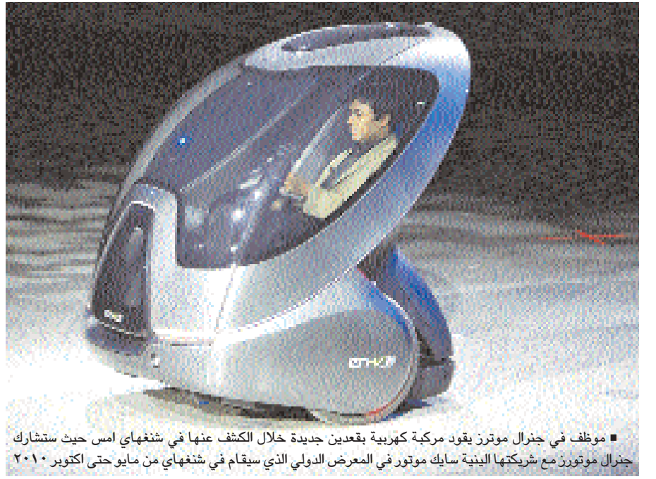
■ موظف في جنرال موتورز يقود مركبة كهربائية جديدة خلال الكشف عنها في شنغهاي امس حيث ستشارك جنرال موتورز مع شريكها البنية سايك موتور في المعرض الدولي الذي سيقام في شنغهاي من مايو حتى اكتوبر ٢٠١٠

■ شنجهاي - رويترز: كشفت شركة جنرال موتورز النقاب امس الاربعاء عن نموذج مبدئي لسيارة جديدة تأمل بان تعزز موقعها في مجال السيارات الكهربائية ليس على الاقل في الصين فقط اكبر سوق للسيارات في العالم. وعرضت جنرال موتورز "المركبة المزودة بشبكة كهربائية" أو إي إن . في في جناح تقاسمه مع مشروعها المشترك في الصين شركة سايك موتور خلال المعرض العالمي الذي سيقام في شنغهاي ابتداء من مايو وحتى اكتوبر. ولن تعرض السيارة إي إن . في في صالات العرض قبل فترة تتراوح بين عشرة و ٢٠ عاما. وسيتم توصيل السيارات بشبكة مع السيارات الاخرى للمساعدة في تفادي الحوادث وتسهيل حركة المرور في المدن الكبيرة المزدحمة مثل شنغهاي. ولكن جنرال موتورز تنظر الى هذا الطراز الذي يبلغ طوله ثلث طول سيارة ركاب عادية للمساعدة في توطيد نفسها