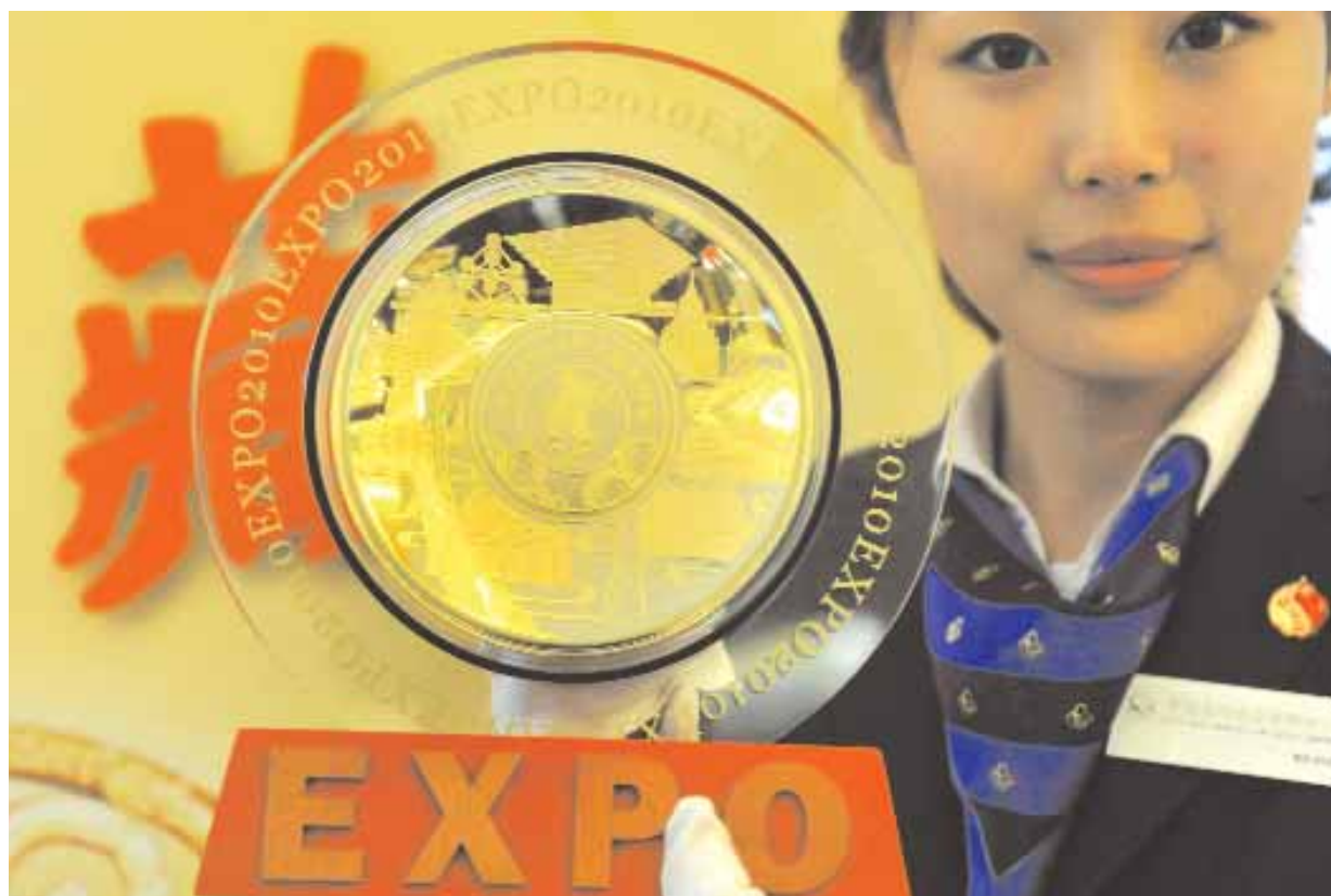
عاملة صينية تعرض صورة تذكارية لمعرض شنغهاي الدولي في بكين أمس وتستخدم المعرض لعرض تزايد النفوذ العالمي للصين بطريقة مماثلة لاوليمبياد بكين ٢٠٠٨.

وتفيد بيانات بنك كوريا المركزي، بأن ديون الأسرة الكورية بلغت في المتوسط ٤٣ مليون وون (٣٨ ألف دولار) العام الماضي بارتفاع قدره ١٢ مليون وون عن عام ٢٠٠٨.