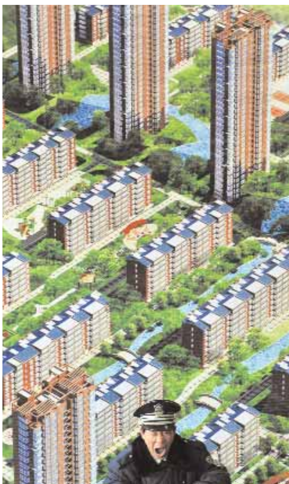
حارس يتأهب أمام مخطط إنشاءات عقارية للاعلان عن تجمعات سكنية جديدة في معرض للعقارات في شينج يانج بإقليم لياوننج أمس وقد أصدرت الصين أمرا إلى ٧٨ شركة غير متخصصة بصورة رئيسية في العقارات ان تغير نشاطها بعيدا عن قطاع العقارات خلال ١٥ يوما