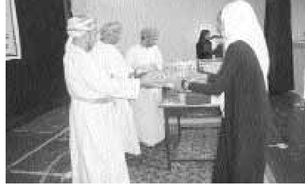
خلال تكريم الطالبات «من المصدر»

تشكلت منها هذه المنطقة والتي تغطي عليها الجبال الحجرية وكذلك بناء الخزانات ومد الأنابيب ووضع الصمامات لها عند مرورها في بطون الأودية وفي نهاية المحاضرة قام بالرد على أسئلة الحضور واستفساراتهم حول