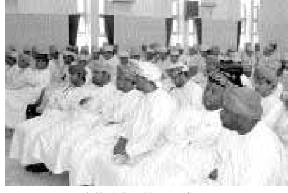
الحضور خلال فعاليات اللقاء «من المصدر»

التعليم العالي حول البعثات والمنح الخارجية وأليات التسجيل والقبول في الجامعات الأوروبية وطريقة الدراسة في نظام البعثات الخارجية وأشار إلى دور دائرة البعثات الخارجية في متابعة الطلبة العُمانيين الدارسين خارج السلطنة والتسهيلات التي تقدم لهم من قبل الوزارة، وذكر أن من أهم التخصصات التي تبعت إليها الوزارة هي: التخصصات اللغوية وتشمل الإنجليزية والفرنسية والألمانية والترجمة والتخصصات الطبية والعلمية وتشمل الطب العام والصيدلة والتمريض والتخصصات الهندسية وتشمل الكيمائية والكهربائية والمدنية والهندسية وغيرها والتخصصات التجارية وتشمل إدارة الأعمال والتسويق وإدارة المشاريع الترفيهية ونظم المعلومات وغيرها بالإضافة إلى التخصصات الطبية (الطب العام وطب الأسنان الصيدلة والتمريض).