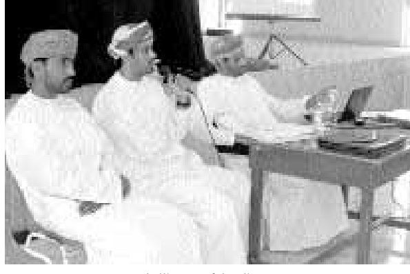
المشاركين في اللقاء «من المصدر»

التعليم العالي حول البعثات والمنح الخارجية وأليات التسجيل والقبول في الجامعات الأوروبية وطريقة الدراسة في نظام البعثات الخارجية وأشار إلى دور دائرة البعثات الخارجية في متابعة الطلبة العُمانيين الدارسين خارج السلطنة والتسهيلات التي تقدم لهم من قبل الوزارة، وذكر أن من أهم التخصصات التي تبعت إليها الوزارة هي: التخصصات اللغوية وتشمل الإنجليزية والفرنسية والألمانية والترجمة والتخصصات الطبية والعلمية وتشمل الطب العام والصيدلة والتمريض والتخصصات الهندسية وتشمل الكيمائية والكهربائية والمدنية والهندسية وغيرها والتخصصات التجارية وتشمل إدارة الأعمال والتسويق وإدارة المشاريع الترفيهية ونظم المعلومات وغيرها بالإضافة إلى التخصصات الطبية (الطب العام وطب الأسنان الصيدلة والتمريض).