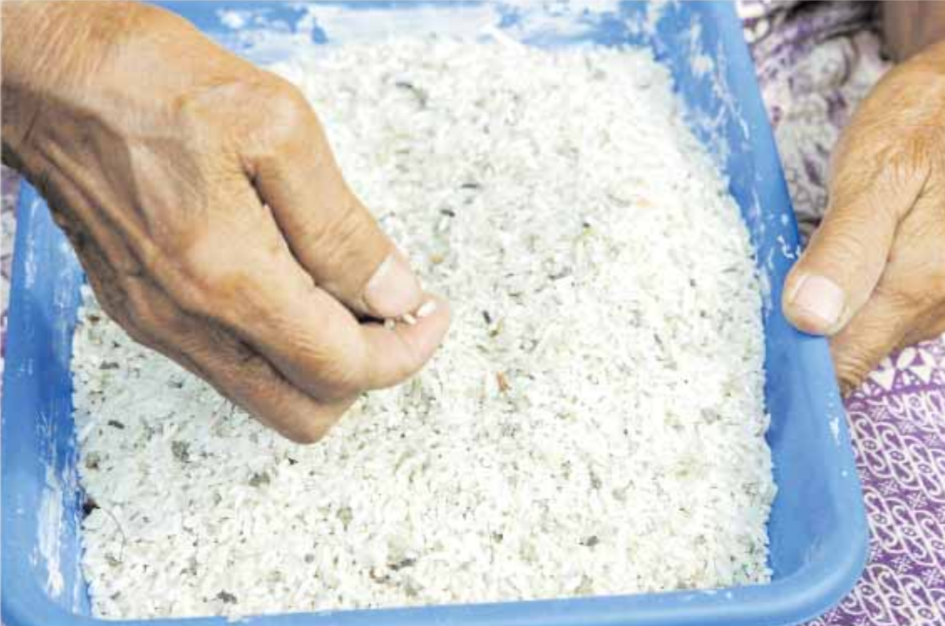
مسنة تفريز الحصى من أرز قامت بجمعه من أرضية سوق للأرز في جاكارتا أمس وتبيع كيلوجرامين من الأرز يوميا مقابل ٥ روبيات (٥٥ سنتا) لتغطي احتياجاتها الأساسية

للاتصال: هاتف: ٢٤٥٦٨٢٠٠ (٩٦٨). فاكس: ٢٤٥٦٠١٠٠ (٩٦٨) e-mail: info@manamhotel.com Website: www.manamhotel.com