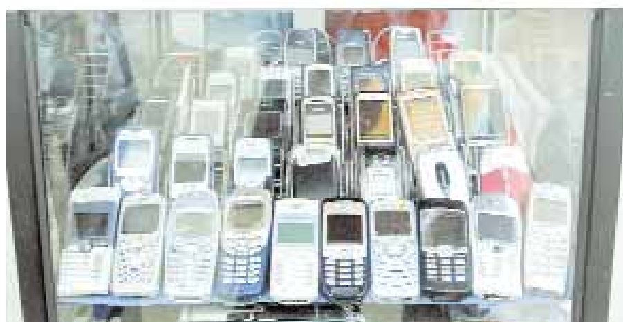
صورة أرشيفية بتاريخ ١٨ أغسطس ٢٠٠٨ لبايع هواتف خلوية نيجيري ينتظر الزبائن في لاجوس. وقد وقعت شركة بهارتي الهندية عقدا لشراء الأصول الإفريقية لمجموعة زين الكويتية بمبلغ ١٠.٧ مليار دولار