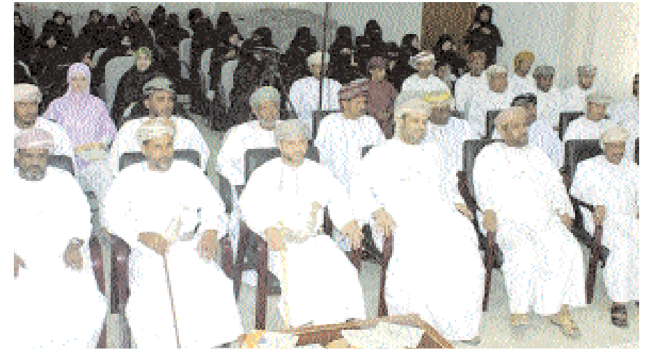
راعي الحفل والحضور