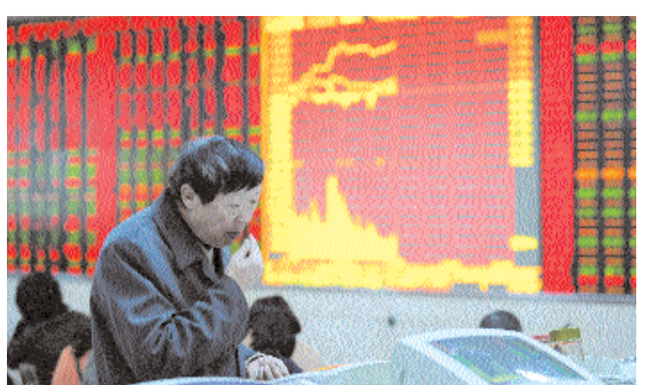
مستثمرون في البورصة الصينية يتابعون حركة الأسهم في شركة للاوراق مالية في هيفي بمقاطعة أنهوى الصينية أمس. وقد بدأت البورصة الصينية في تجريب معاملات طال انتظارها للتداول بالهامش والبيع قصير الأجل في إجراءات تهدف الى تقديم خيارات استثمارات أكثر تقدماً

وتسيطر خزانة - ذراع وزارة المالية للاستثمار - على بعض أكبر الشركات المدرجة في البورصة الماليزية. وتبلغ حصة المستثمرين الأجانب ٢٠ بالمئة فقط من سوق الأسهم الماليزية نتيجة استحواذ المؤسسات الحكومية على حصص كبيرة بالسوق. وتقدر أصول صندوق ادخار الموظفين بأكثر من ٣٦٠ مليار رنجيت (١١,٢ مليار دولار) وهو من أكبر المستثمرين في البورصة الماليزية إذ يستحوذ على حصص في جميع الشركات الماليزية الكبرى المدرجة تقريبا. وقال الصندوق في الآونة الأخيرة إنه يعتزم زيادة استثمارات الخارج إلى عشرة بالمئة من إجمالي أصوله مقارنة بنحو ستة بالمئة حاليا وقال رئيس الوزراء الماليزي نجيب عبدالرازق في النموذج الاقتصادي الجديد الذي كشف عنه أمس الاول الثلاثاء إنه ينبغي التعجيل بهذه العملية. وقال أصلان إن الصندوق قد يزيد تعرضه للأسواق الخارجية إلى ١٥ بالمئة من قيمة أصوله الاجمالية. وأضاف "نحتاج لمزيج من الأوراق المالية والسندات الحكومية وأصول الخزنة والعقارات وهكذا". بالنسبة لما خصصه للأسهم يمكننا زيادته إلى ٣٠ بالمئة هذا العام لكن بالنسبة للاستثمارات الخارجية أشعر أن المستوى المريح بالنسبة لنا هو ١٥ بالمئة من إجمالي أموالنا وفي فئات متنوعة من الأصول".