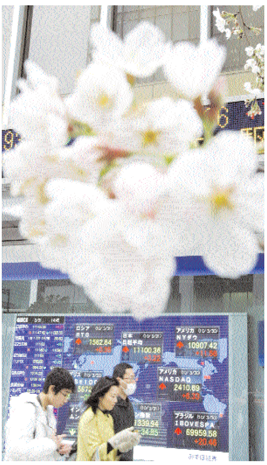
زهور الكرز أمام لوحة أسعار أسهم أمام مؤسسة للوساطة في طوكيو أمس. وقد سجل مؤشر نيكي ارتفاعاً في ١٨ شهراً أمس الأربعاء في آخر يوم من العام المالي مع توقع المزيد من المكاسب في ربيع السنة الجديد

طوكيو - رويترز: ارتفع المؤشر القياسي للأسهم اليابانية إلى أعلى مستوى خلال جلسة تعامل في ١٨ شهرا قبل أن يتخلى عن مكاسبه امس الأربعاء اليوم الأخير في السنة المالية ولكن من المتوقع ان يحقق المزيد من المكاسب في الربع الأول من السنة المالية الجديدة مع انتعاش الاقتصاد العالمي.