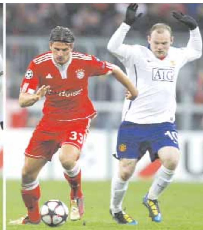
■ صورة مركبة للحظة اصابة روني في كاحله