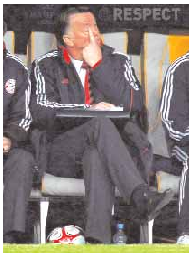
■ فان جال مدرب بايرن ميونيخ يتابع أداء لاعبيه أمام اليوناييتد

جزء) والبرازيلي ميشال باستوس (٣٢) أهداف ليون، والعربي مروان الشماخ (١٤) هدف بوردو والخسارة هي الثانية لبوردو في مدى أربعة أيام بعد سقوطه بالتتيجة ذاتها أمام مرسليليا السبت الماضي في نهائي كأس رابطة الاندية الانجليزية المحترفة لكن ليون سيخسر جهود لوبيز صاحب اللقب الثاني في البطولة