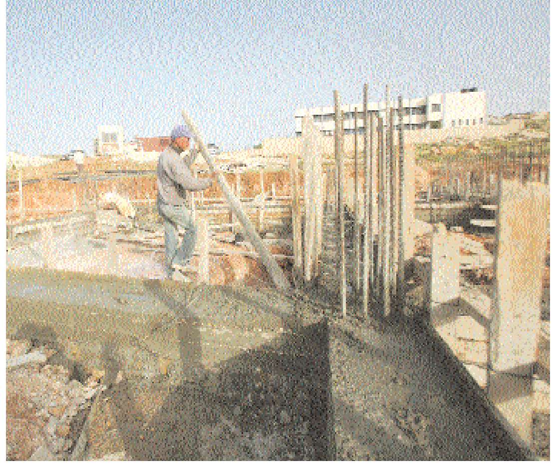
عامل بناء يعمل في موقع انشاءات بالقرب من بيت لحم في اطار مشروع تموله الحكومة الفرنسية لانشاء منطقة صناعية بالمنطقة.

واشنطن تضع التعامل مع سوريا «أولوية» لإحلال السلام ■ حماس تنتقد الطرح الأميركي لاستئناف المفاوضات