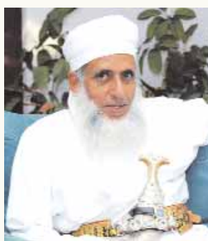
يجيب عن أسئلتكم سمحة الشيخ العلامة أحمد بن محمد الخليلي المفتي العام للسلطنة

الله عليه وسلم . احب نساته اليه في شهر شوال وبنى بها في شهر شوال ، وهي عائشة الصديقة بنت