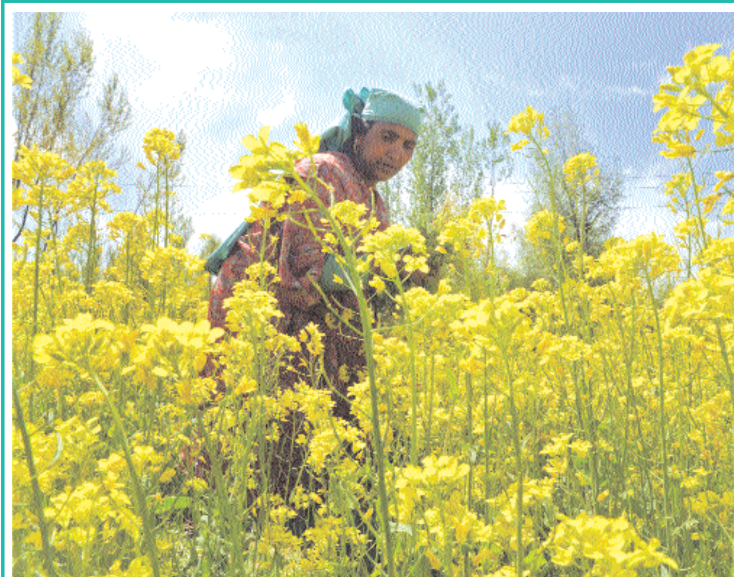
■ امرأة كشميرية تعمل في حقل للخردل بالقرب من مدينة أوأنتيبورا، جنوب سريناجار، عاصمة إقليم جامو وكشمير. وقد ذكرت دائرة الزراعة في حكومة إقليم جامو وكشمير أن وادي كشمير يمتلك حوالي ٦٥ ألف هكتار مزروعة بالخردل

■ هانوي - (د ب أ): أكد أحد المستثمرين الذين كانوا يبنون بناء فندق في حديقة عامة بهانوي وتم إلغاؤه العام الماضي بسبب معارضة الرأي العام أن المستثمرين طالبوا التعويض. وقال المستثمر، الذي طلب عدم ذكر اسمه، أمس إن اتحاد شركات (إس أي إتش انفسمنت) ومقره سنغافورة قد أرسل خطابا إلى رئيس مجلس إدارة لجنة الشعب في هانوي جيون تي تاو في منتصف مارس الماضي طالبا مبلغ ٨٠ مليون دولار وقطعة أرض أكبر على سبيل التعويض عن إلغاء المشروع الأساسي في المدينة. كان قد تم إلغاء أعمال بناء فندق (ساس هانوي رويال) في حديقة إعادة التوحيد في أبريل من العام الماضي بسبب انتقادات عامة قوية. وعرضت المدينة على المستثمرين استغلال قطعة أرض مساحتها ٧٥٠٠ متر مربع في وسط هانوي ويشغلها حاليا مصنع لإنتاج بيرة الأرز ملوك للدولة. وذكرت صحيفة (تين فون) إن اتحاد الشركات (إس أي إتش) اشتكى من أن قطعة الأرض أصغر من المساحة المحددة أصلا وفي خطابه طالب بقطعة أرض مساحتها ٢٤ ألف متر مربع في إحدى ضواحي المدينة. وجاء الجانب الأكبر من مبلغ التعويض ويبلغ نحو ٦٥ مليون دولار كتعويض عن (تكلفة الفرصة البديلة) إذ قالت الشركة إنها تكبدت خسائر لعدم استثمار رأس المال في مكان آخر. وقال تار للصحيفة إن المدينة لم تقبل بهذا الطلب وأنه طالب المدققين الحسابيين بالدولة بإجراء حساباتهم بشأن تعويض المستثمرين.