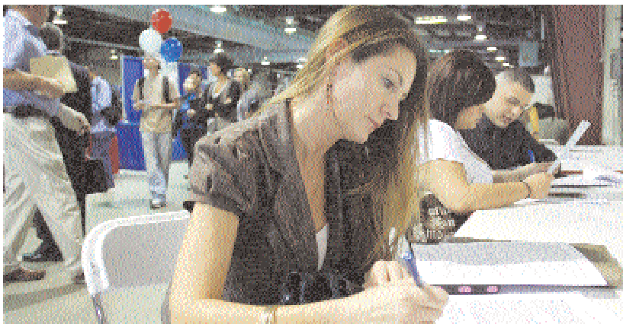
■ شابة أميركية تعين طلب عمل خلال معرض أيرزونا المهني لتشغيل القوى العاملة والذي أقيم على ملاعب ستيت فير بمدينة فينيكس من ولاية أريزونا الأميركية أمس الأول. وتشير الإحصائيات إلى أنه قد تم خسارة ٢٢ ألف وظيفة في القطاع الخاص خلال شهر مارس الماضي، وحذر تيموثي جيبتر مؤخرًا الأميركية الباحثين عن عمل من أن وضعية البحث عن عمل خلال عام سوف تظل مرتفعة

■ لندن - رويترز: سجل الذهب تغيرا طفيفا أمس ليقارب أعلى مستوياته خلال أسبوعين إذ عوض نقص الطلب الفعلي من ضعف عمليات الشراء للمعدن كملاد آمن. وسجل الذهب أعلى مستوياته خلال الأسبوع عند ١١١٥.١٠ دولار للأوقية (الأونصة) ليقارب أعلى مستوياته خلال أسبوعين والذي سجله أمس الأول عند ١١١٧.٩٠ دولار وبحلول الساعة ٠٦:٥٤ بتوقيت جرينتش بلغ سعر الذهب في المعاملات الفورية ١١١١.٩٥ دولار للأوقية مقارنة مع ١١١٢.٨٠ دولار في أواخر المعاملات ببورصة نيويورك أمس الأول. وصعد سعر الفضة إلى ١٧.٥١ دولار للأوقية من ١٧.٤٦ دولار أمس الأول. كما ارتفع سعر البلاتين إلى ١٦٤٢ دولار للأوقية من ١٦٤١.٥٠ دولار واستقر سعر البلاتين دون تغيير يذكر عند ٤٧٧.٥٠ دولار للأوقية في نيويورك. ■