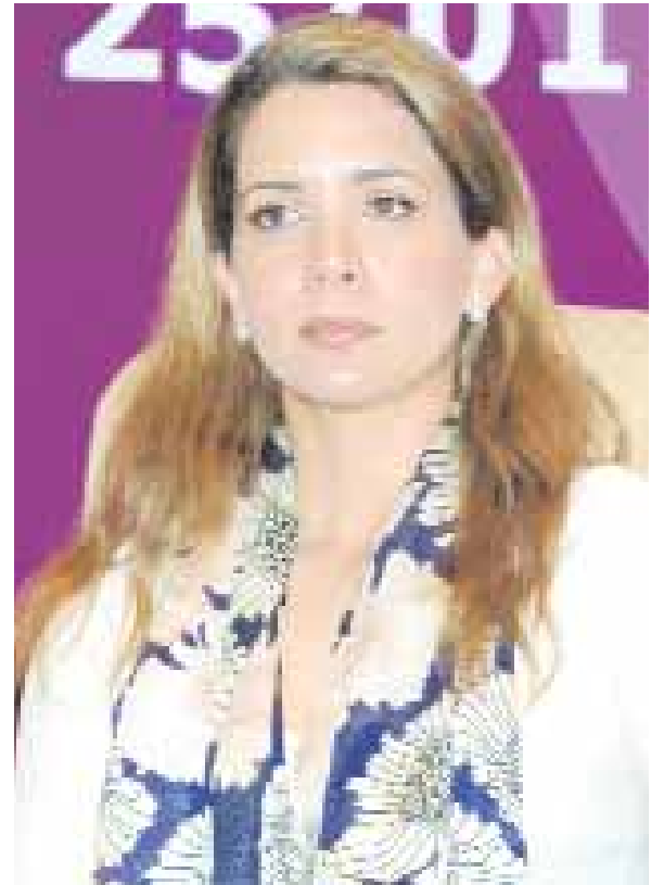
■ هيا بنت الحسين

■ دبي - ا.ف.ب: أعلنت الاميرة هيا بنت الحسين زوجة الشيخ محمد بن راشد آل مكتوم نائب رئيس دولة الامارات وولي عهد دبي عزمها الترشيح لولاية ثانية على رأس الاتحاد الدولي للفروسية. وكانت الاميرة هيا بنت الحسين فازت برئاسة الاتحاد الدولي للفروسية في الاول من مايو عام ٢٠٠٦ حيث حصلت على اكبر نسبة من الاصوات متقدمة على منافسيها الاميرة الدنماركية بينيديكت ونائب رئيس الاتحاد الدولي فريدي سيربييري. وقالت رئيسة الاتحاد الدولي في تصريح بثته وكالة "وام" الاماراتية "يشرفني ان احظى بخدمة رياضة الفروسية واتحادها عبر السنوات الاربعة الماضية. لقد احببت هذا العمل كثيرا وحالفنا النجاح في بناء فريق متميز يسعدني ان اواصل العمل معه". وتابعت "منحتني هذه الرياضة بعضا من اسعد لحظات حياتي ويسعدني ان انال هذه الفرصة لكي ارد لها البعض مما اكتسبته. لقد شهد الاتحاد الدولي للفروسية تغيرات جذرية خلال الفترة الماضية لذا ستركز هدفي خلال المرحلة المقبلة في ترسيخ فترة هدوء نكرس خلالها التقدم الذي احرزناه سويا". وكانت الاميرة هيا مثلت الاردن في دورة الالعاب الاولمبية في سبدي عام ٢٠٠٠، وكانت اول عربية تشارك في مسابقة الفروسية في الدورات الاولمبية، كما شاركت في بطولة العالم في مدينة خيريز الاسبانية ٢٠٠٢ وبطولة دبي للتحمل ٢٠٠٥. وسبق لها ايضا ان مثلت الاردن في الجمعية العامة للاتحاد الدولي للفروسية وشغلت منصب رئيس مجموعة الشرق الاوسط وغرب اسيا بين عامي ١٩٩٢ و١٩٩٦.