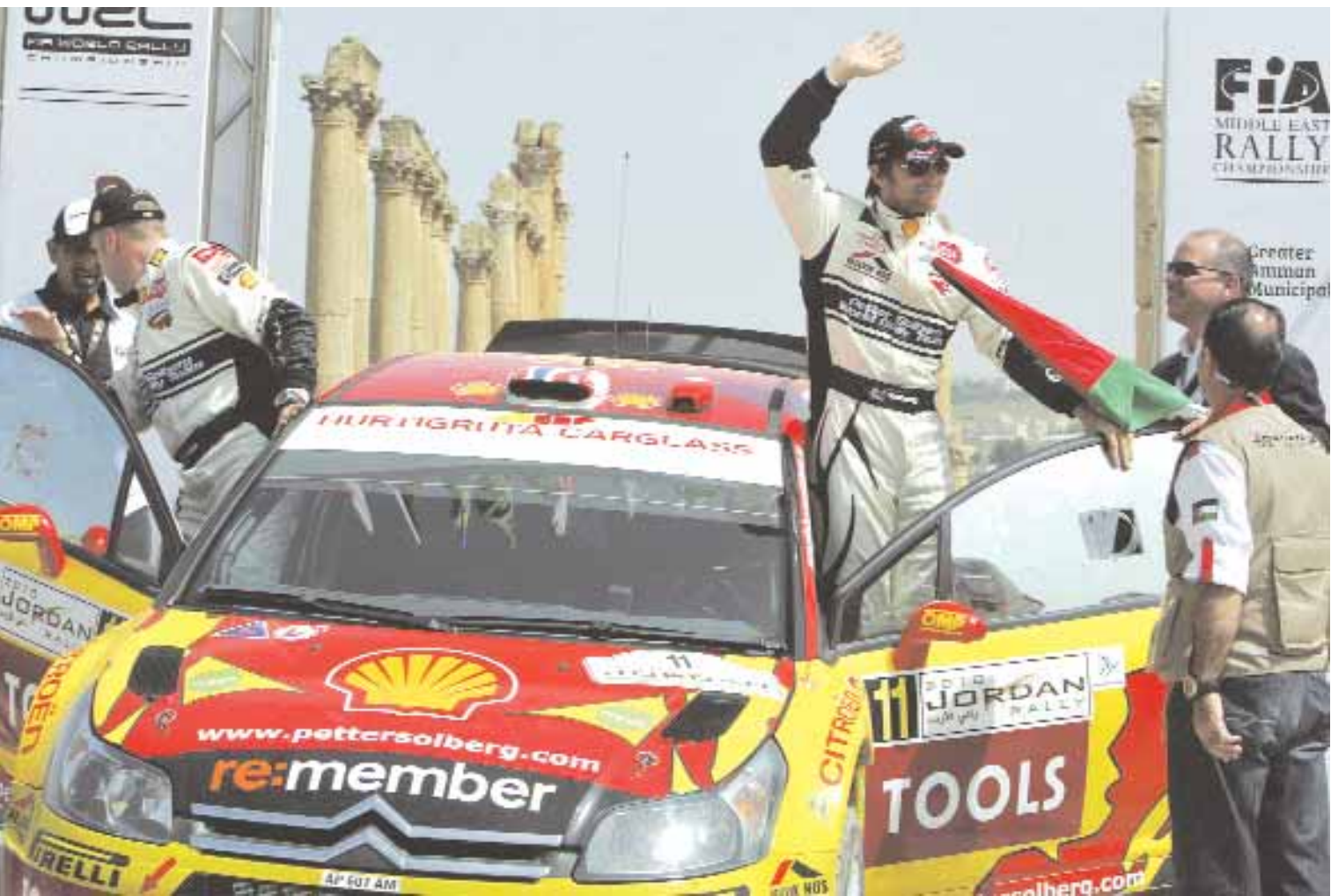
■ السائق النرويجي بيتر سولبرج (يمين) وزميله فيل ميللز من ويلز (يسار) يلوحان للجماهير خلال بداية سباق الأردن للسيارات في جرت على بعد حوالي ٣٠ ميلاً من عمان بالأردن أمس.

■ القاهرة - رويترز: قال نادي الزمالك وصيف متصدر الدوري المصري الممتاز لكرة القدم إنه سيخوض مباراة ودية مع فريق بني ياس الإماراتي اليوم في مدينة السادس من أكتوبر. وأضاف الزمالك بموقعه على الانترنت أن المباراة "تأتي في اطار استعدادات الفريق لمواجهة اتحاد الشرطة في الجولة ٢٥ لمسابقة الدوري والمقرر لها الأربعاء القادم والتقى الزمالك مع بني ياس بداية هذا الموسم وفاز الفريق المصري ١-٣ وقال الزمالك أيضاً إن حسام حسن مدرب الفريق قرر إعادة الثنائي أحمد الميرغني وحازم إمام لمران الفريق بعد التزامهما في الفترة الأخيرة فيما لم يتخذ الجهاز الفني قراراً بإعادة المهاجم أحمد فتحي (بوجي) للمران الجماعي ويعيش الزمالك مرحلة من التألق تحت قيادة حسن وفاز الفريق عشر مرات في اخر ١١ مباراة بالدوري وقفز إلى المركز الثاني في الدوري برصيد ٤٦ نقطة متأخراً بست نقاط عن الأهلي المتصدر الذي يتبقى له مباراة مؤجلة قبل ست جولات من نهاية البطولة. ■