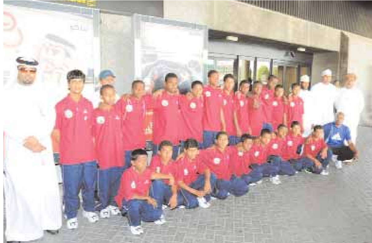
المنتخب العماني فور وصوله مطار البحرين