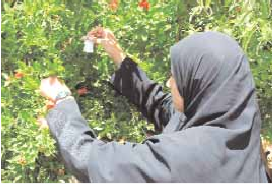
■ خلال إطلاق الطفيلات بإحدى مزارع الجبل الأخضر

الترايكوجراما من أهم الأعداء الطبيعيين لهذه الحشرة حيث إن الطفيل يتطفل على بيض فراشة ثمار الرمان وذلك من خلال وضع بيوضه داخل بيض حشرة فراشة ثمار الرمان وعندما يفقس بداخلها يتغذى على محتوياتها وبذلك يقطع دورة حياة الفراشة وهذا الطفيل لا يتسبب في أي أضرار أخرى سواء على الأشجار أو الأعداء الطبيعيين الآخرين ، ومع نهاية كل موسم يتضاءل وجود هذا الطفيل أو يكاد يختفي إذا لم يجد عائلًا يتطفل عليه.