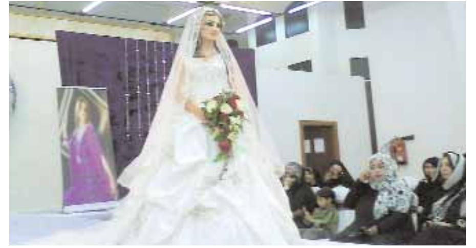
■ خلال تقديم بعض العروض من المشاركات في معرض عروس صحار