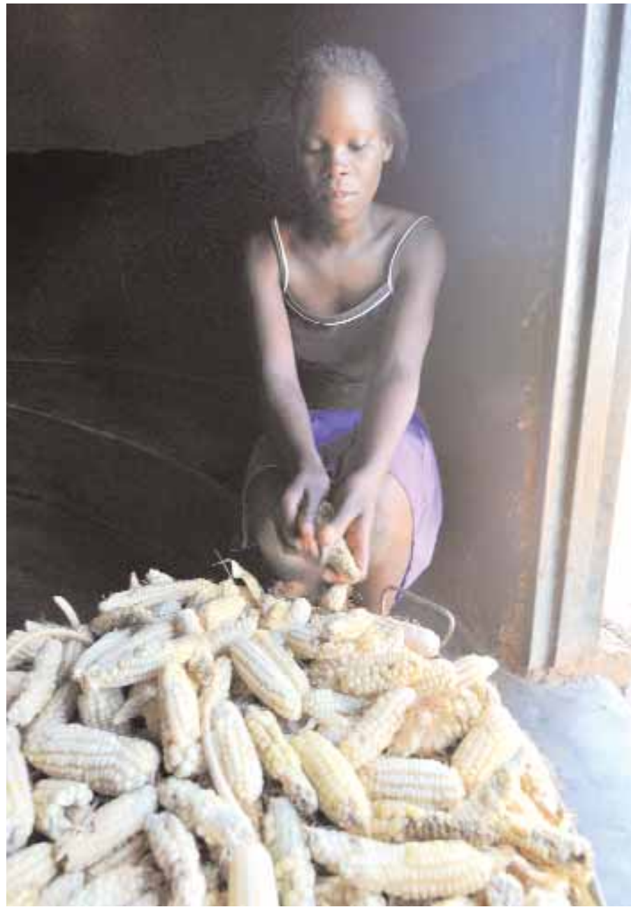
فتاة زيمبابوية تقشر محصول الذرة الذي تم جمعه من حقل أسرتها هذا العام في قرية كوارا بمدينة زاكا جنوب زيمبابوي. ويعيش ٧٥٪ من سكان زيمبابوي تحت خط الفقر على الرغم من وفرة الإنتاج الزراعي في هذه الدولة الإفريقية.

دار السلام (تنزانيا) - رويترز: قال الصندوق الدولي للتنمية الزراعية (إيفاد) التابع للأمم المتحدة إن الحكومات الأفريقية عليها أن تساعدا حائزي المساحات الصغيرة من الأراضي الزراعية على تحقيق أرباح إذا أردت أن تطعم الجياع وتوقف هجرة صغار السن من المناطق الريفية. وقال كاتايو نوانزي رئيس إيفاد إن المزارعين في المناطق الريفية ينتجون ٨٠ في المئة من الغذاء المستهلك في القارة لكن الحكومات فشلت في توفير البنية التحتية التي يحتاجونها للنمو والتطور.