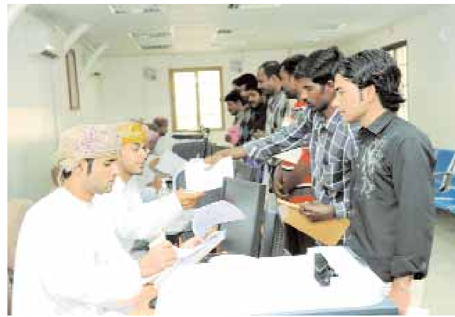
أعداد متزايدة كبيرة من الأيدي العاملة الوافدة توقف أوضاعها

أكثر من ٢٢,٨ ألف عامل أبدو رغبته في المغادرة النهائية