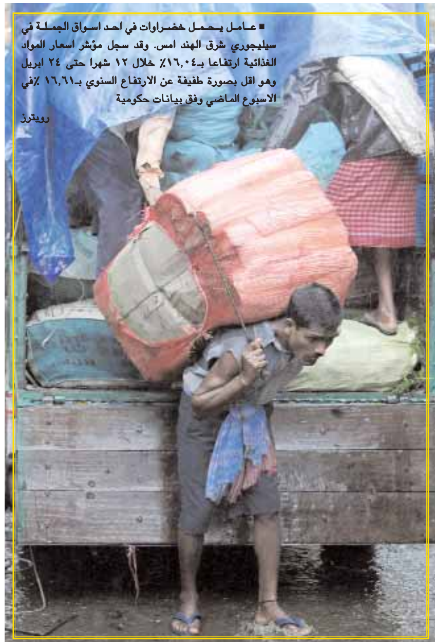
عامل يحمل خضراوات في احد اسواق الجملة في سيليجوري شرق الهند أمس. وقد سجل مؤشر أسعار المواد الغذائية ارتفاعاً بـ ١٦.٠٤٪ خلال ١٢ شهراً حتى ٢٤ أبريل وهو أقل بصورة طفيفة عن الارتفاع السنوي بـ ١٦.٦١٪ في الأسبوع الماضي وفق بيانات حكومية

جنيف - د.ب.أ: أظهرت بيانات رسمية صدرت أمس الجمعة أن مبيعات قطاع التجزئة في سويسرا تراجعت بنسبة ٠.٩٪ في مارس مقارنة بالشهر السابق عليه مع أخذ العوامل الموسمية في الحسبان. ووفقاً لمكتب الإحصاء الاتحادي، شهد قطاع التجزئة مع استثناء الوقود تراجعاً بنسبة ٠.٧٪ مع احتساب العوامل المتغيرة نتيجة هبوط مبيعات الأغذية والمشروبات والتبغ. فيما أظهر القطاع غير الغذائي نمواً إيجابياً بنسبة ٠.٣٪. وبالمقارنة بشهر مارس من العام الماضي، زادت مبيعات التجزئة بنسبة ٥.٢٪.