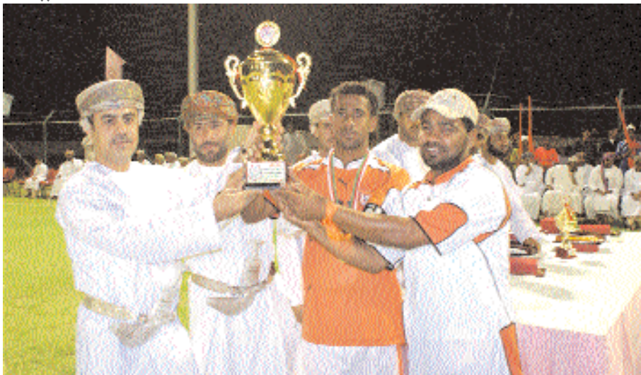
تتويج البطل باللقب