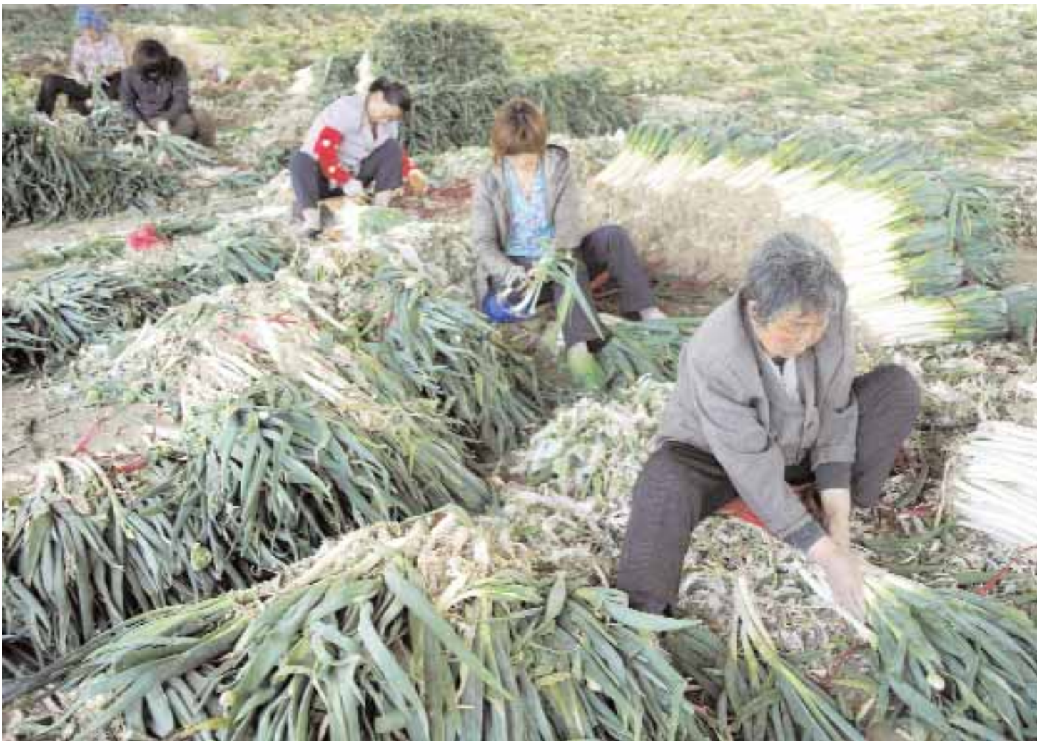
عمال يجمعون البصل الأخضر في أكوام في سوق للجمل في هوايبي بمقاطعة أنهوي الصينية أمس.

١٠٠٠٠٠ كم* ضمان ٣ سنوات* ١٠٠٠ لتر وقود مجاني* • ١٠٠٠٠٠ كم* ضمان محدد* • خدمة المساعدة على الطريق مع اتحاد السيارات العربية • تمويل سهل وسريع* • عرض خاص للمدرسين* • عرض خاص لسيارات الأجرة وتعليم السياقة* *تحت شروط وأحكام