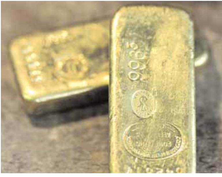
صورة أرشيفية بتاريخ ٢٩ أبريل الماضي لسبكتين من الذهب في باريس وقد سجلت أسعار الذهب ارتفاعا قياسيا جديدا إلى نحو ١٢٥٠ دولار للأوقية أمس مع إقبال المستثمرين عليه ككلاذ آمن وسط تزايد الفلق حول الأزمة المالية في منطقة اليورو

لندن - وكالات: سجل سعر الذهب رقما قياسيا جديدا مقاربا ١٢٥٠ دولارا، في حين يجذب المعدن الأصفر المستثمرين الذين يخشون من المخاوف المتنامية حيال ديون دول منطقة اليورو. وبلغ سعر أونصة الذهب ١٢٤٩,٤٠ دولارا في سوق التداول في لندن التي تعتبر سوقا مرجعية عالمية، قبل أن يخسر دولارين في الدقائق التالية. ولفت الاقتصاديون في كورمس بنك "أن الذهب سيواصل الاستفادة في ظل المخاوف المتواصلة، من طلب كبير وستتحسن أسعاره بشكل مطرد، في حين ستعمل العتية النفسية المهمة البالغة الف يورو على جذب المزيد من المستثمرين". ولمس الذهب الجمعة عتية ٩٩٥ يورو. وواصل الذهب المقوم باليورو والاسترليني والفرنك السويسري الصعود فوق مستويات قياسية سجلها هذا الشهر مع لجوء المستثمرين القلقين بشأن مستقبل العملات الأوروبية إلى الذهب كأصل بديل. وارتفعت الفضة إلى ١٩,٥٧ دولار للأوقية وانخفض البلاتين إلى ١٧٢١,٠٥ دولار للأوقية وهبط البلاتين إلى ٥٣٤,٠٥ دولار للأوقية