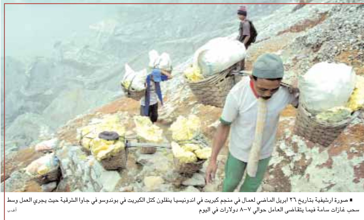
صورة ارشيفية بتاريخ ٢٦ ابريل الماضي لعمال في منجم كيريت في اندونيسيا ينقلون كتل الكيريت في بوندوسو في جاوا الشرقية حيث يجري العمل وسط سحب غازات سامة فيما يتقاضى العامل حوالي ٧-٨ دولارات في اليوم

اسطنبول - رويترز: قالت وزارة المالية في تركيا أمس الجمعة إن عجز الموازنة بلغ ٤,٤٥٥ مليار ليرة (٢,٩ مليار دولار) في أبريل بانخفاض عن مارس لكن بارتفاع حاد مقارنة بنفس الشهر من العام الماضي بسبب ارتفاع مدفوعات الفائدة. وكانت الحكومة التركية تعهدت ببيع الانفاق وتعزيز حصيلة الضرائب بهدف تقليل العجز الذي تضاعف إلى ثلاثة أمثاله في العام الماضي عندما لجأت أنقرة إلى الانفاق للخروج من الأزمة الاقتصادية. وأفادت البيانات إن العجز في أبريل ارتفع بنسبة ٢٧٠,٦ في المائة مقارنة بالعام الماضي حينما سجل ٩٤٧ مليون ليرة لكنه انخفض من ٥,٩ مليار في مارس.