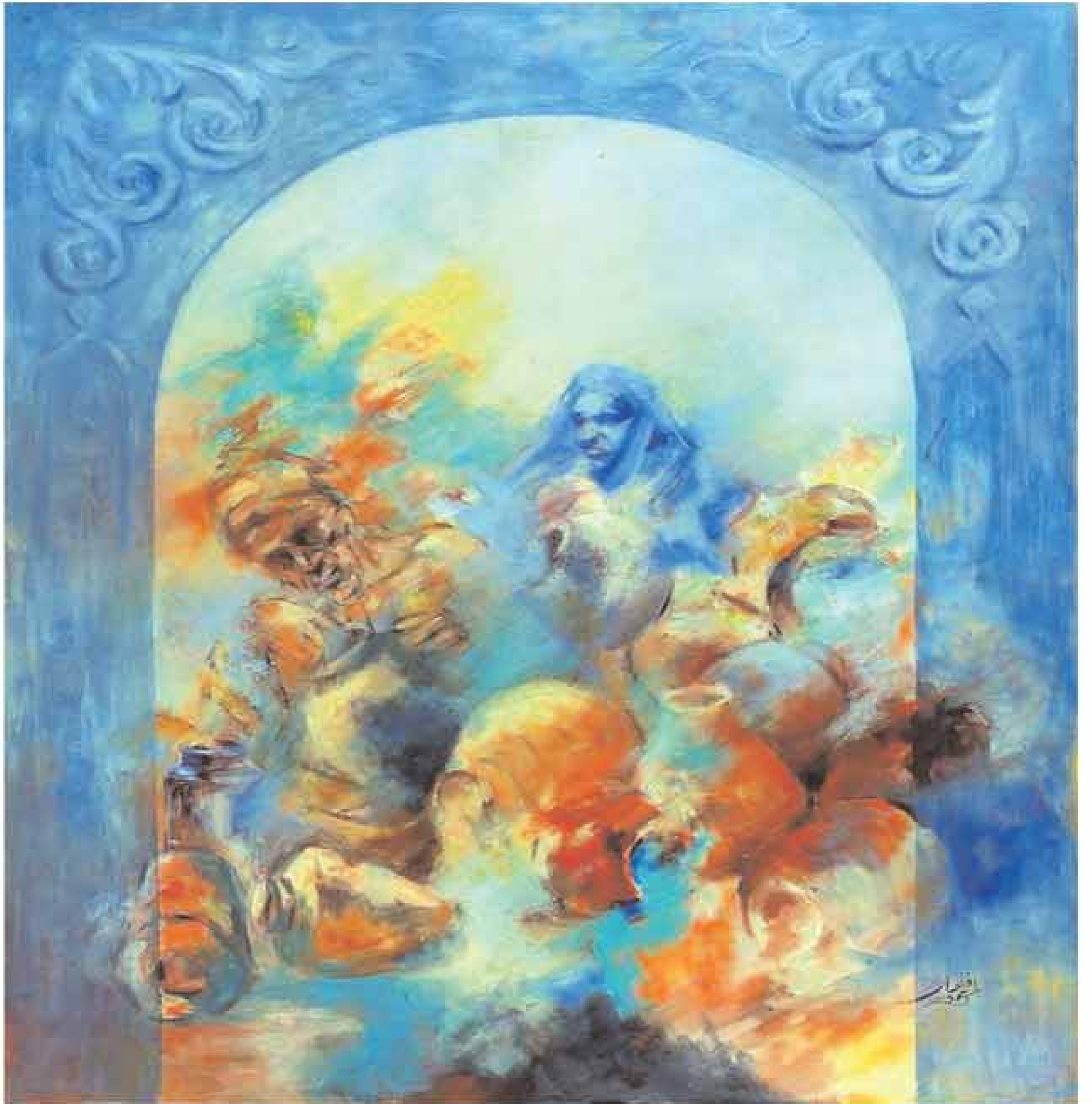
■ اللوحة للفنانة افتخار البدوي