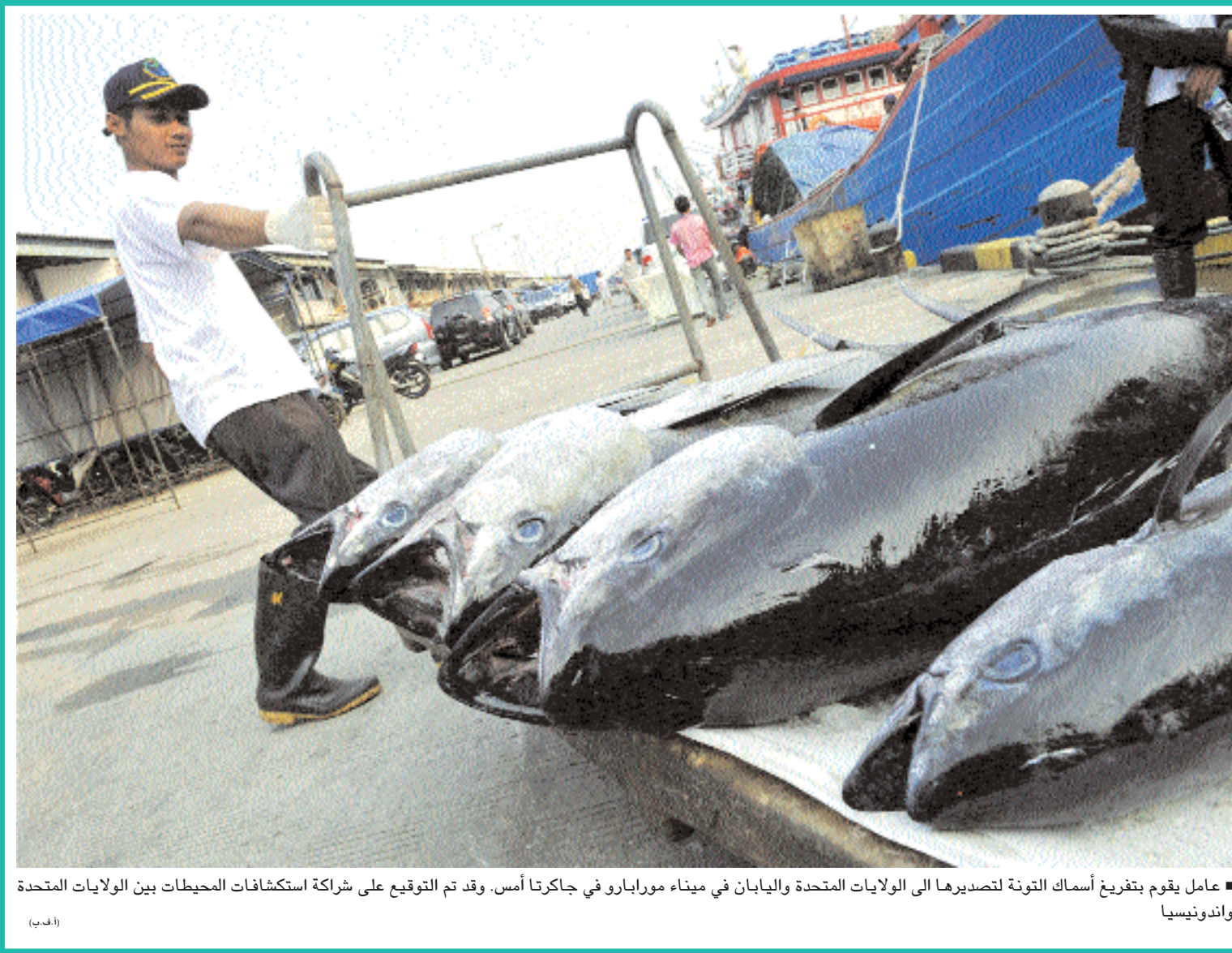
■ عامل يقوم بتفريغ أسماك التونة لتصديرها الى الولايات المتحدة واليابان في ميناء مورابارو في جاكارتا أمس. وقد تم التوقيع على شراكة استكشافات المحيطات بين الولايات المتحدة واندونيسيا