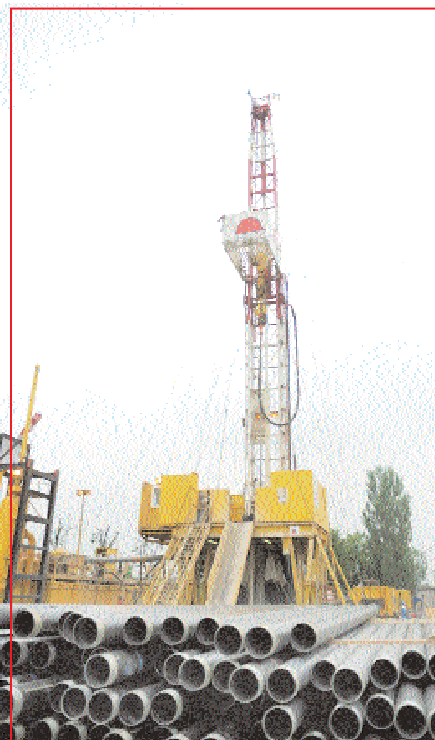
■ عمليات حفر بئر للطاقة الحرارية الأرضية بالقرب من مطار أورولي في باريس في ١٤ مايو ٢٠١٠. حيث يخطط المطار لتوفير من ٢٥ إلى ٣٠ من احتياجاته من الطاقة الحرارية الأرضية

هونج كونج - د. ب. قال مسؤولون أمس إن هونج كونج استقبلت ١١٤ مليون سائح في رقم قياسي خلال الأشهر الأربعة الأولى من العام الجاري بما يزيد بنسبة ١٦٪ عن الفترة نفسها من العام الماضي. وأظهرت بيانات مجلس السياحة أن أكثر من ٧٢ مليون سائح جاء من بر الصين الرئيسي بينما جاء ١٥ مليون سائح من مناطق بعيدة. وتعززت صناعة السياحة بفضل رفع قيود السفر في جنوب الصين منذ عام ٢٠٠٣ الأمر الذي سمح لملايين آخرين من المواطنين بعبور الحدود إلى داخل المستعمرة البريطانية سابقا. ومن المتوقع أن يتجاوز عدد السياح القادمين إلى هونج كونج في العام الحالي حاجز ٣٠ مليون سائح مقارنة بمستوى قياسي سابق بلغ ٢٩.٦ مليون سائح في العام الماضي. ■