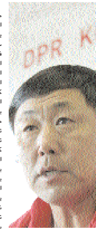
■ كيم جونج

■ سول - رويترز: يمثل بقية أعضاء منتخب كوريا الشمالية لكرة القدم بحيط العوض بالمدرّب كيم جونج هون ولا يعرف عنه إلا القليل. وكيم مدافع دولي سابق ويزعج نجمه عندما تولى قيادة فريق كرة القدم للرجال للمجموعة الرياضية 25 أبريل رفيعا المستوى وهي الجناح الرياضي للجيش الشعبي الكوري الشمالي. واختير كيم لتدريب منتخب كوريا الشمالية في 2007 واعتمد على الصرامة الدفاعية روح الفريق ليقيده بلاده للتأهل لنهائيات كأس العالم لأول مرة منذ 1966. وشارت تكهنات حول تعيين مدربين بارزين مثل فيليب تروسييه وسفين جوران اريكسون بدلا من كيم لقيادة كوريا الشمالية في النهائيات التي تقام بجنوب أفريقيا لكنه ثبتت بوظيفته وسيقود الفريق في مسيرته بالمجموعة السابعة حيث سيتنافس مع البرازيل والبرتغال وساحل العاج. ولم يكشف كيم (53 عاما) إلا القليل حول نفسه أو فريقه في المرّات النادرة التي تحدث فيها لوسائل الاعلام واكتفى بالإشارة بثبات منتخب كوريا الشمالية ووضع هدفا للفريق وهو التأهل لدور الستة عشر في جنوب أفريقيا. ■