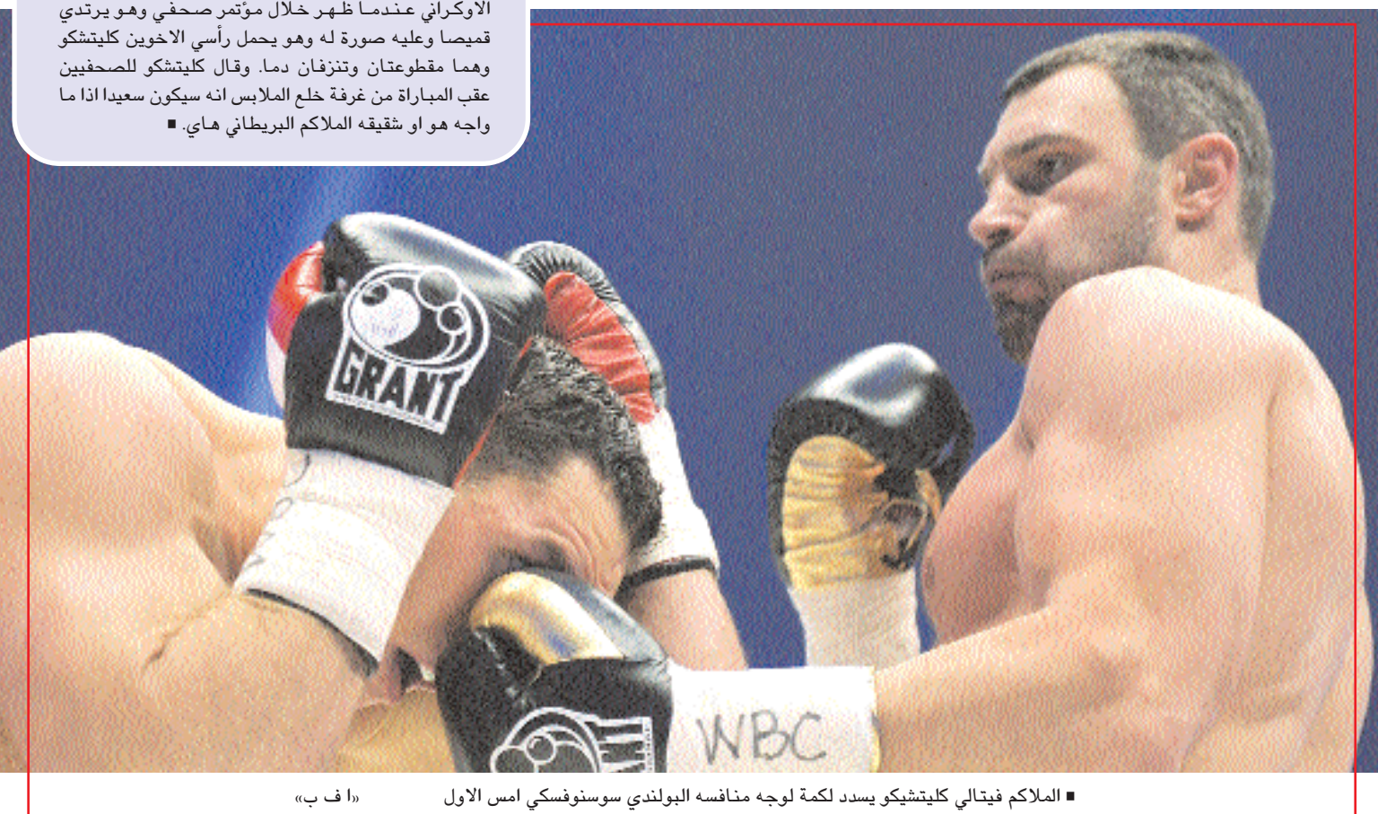
■ الملاكم فيتالي كليتشكو يسدد لكمة لوجه منافسه البولندي سوسنوفسكي امس الاول