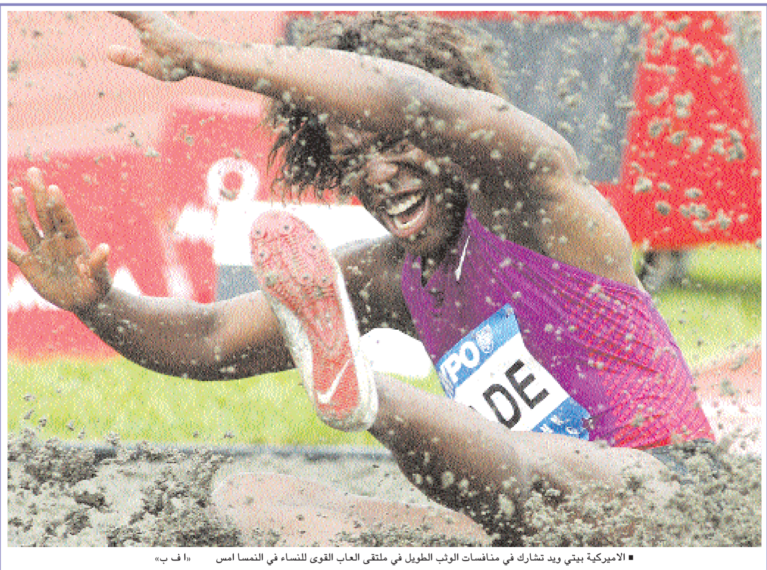
■ الاميركية بيتي ويد تشارك في منافسات الوثب الطويل في ملتقى ألعاب القوى للنساء في النمسا امس