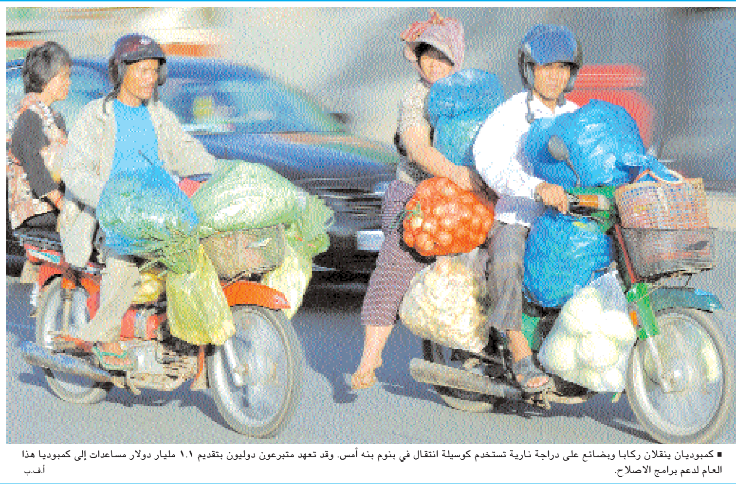
■ كمبوديان ينقلان ركابا ويصان على دراجة نارية تستخدم كوسيلة انتقال في بنوم بنه أمس. وقد تعهد متبرعون دوليون بتقديم ١.١ مليار دولار مساعدات إلى كمبوديا هذا العام لدعم برامج الإصلاح.

■ سيدني - دب.أ: بدأت الشرطة الأسترالية أمس الاثنين تحقيقا في مزاعم بأن شركة جوجل، عملاق البحث على الإنترنت، انتهكت قوانين الخصوصية عندما سعت السيارات المجهزة التابعة لخدمة خرائط جوجل إلى الحصول على معلومات خاصة عن أصحاب المنازل. ويأتي التحقيق وسط حرب كلامية بين الحكومة وجوجل، حيث وصف وزير الاتصالات الأسترالي ستيفين كونروي تصرفات جوجل بأنها "الانتهاك الأكبر في تاريخ الخصوصية" عندما قامت سياراتها التي تعمل على توفير خدمة "ستريت فيو" التابعة لها بجمع معلومات من شبكات لاسلكية. ونفى كونروي أن يكون تحرك حكومته مجرد انتقام بسبب معارضة جوجل لخطة الرامية إلى وضع مرشحات للسيطرة على الوصول إلى محتوى الإنترنت. وقال كونروي "عبرت عن مخاوفي بشأن هذه التحقيقات الشرطة".