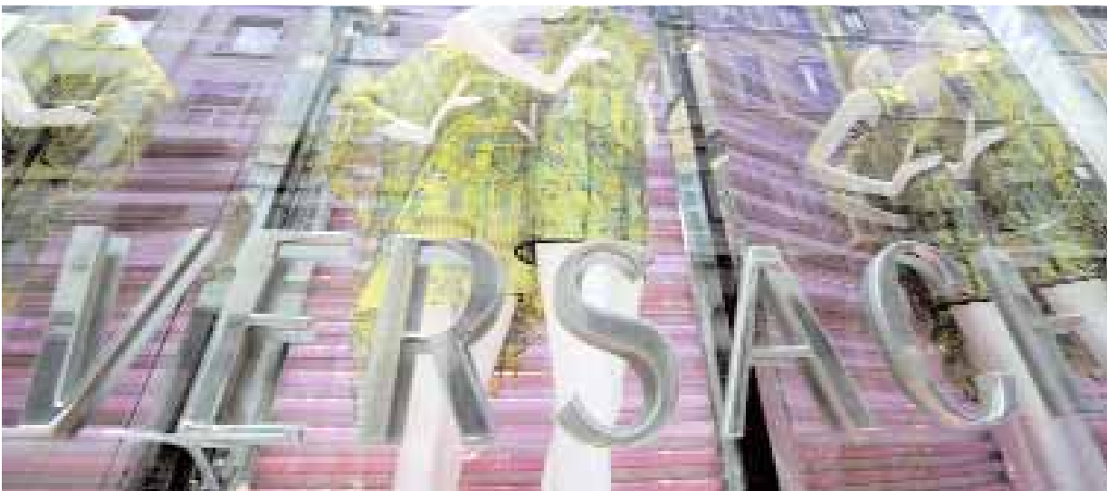
واجهة متجر فيرسانشي في ميلان أمس. وقد أعلنت مجموعة فيرسانشي عن زيادة خسائرها إلى ٤٩,٦ مليون يورو في ٢٠٠٩ من ١,٨ مليون يورو في العام الأسبق مع تقلص المبيعات بسبب الأزمة الاقتصادية وخطة إعادة الهيكلة «ا ف ب»

اشنغهاي - بكين - رويترز: قالت مصادر امس إن الصادرات الصينية نمت بنحو ٥٠ بالمائة في مايو مقارنة بالفترة ذاتها من العام الماضي لتتجاوز توقعات سابقة وتخذي ارتفاعا في أسواق الأسهم العالمية.