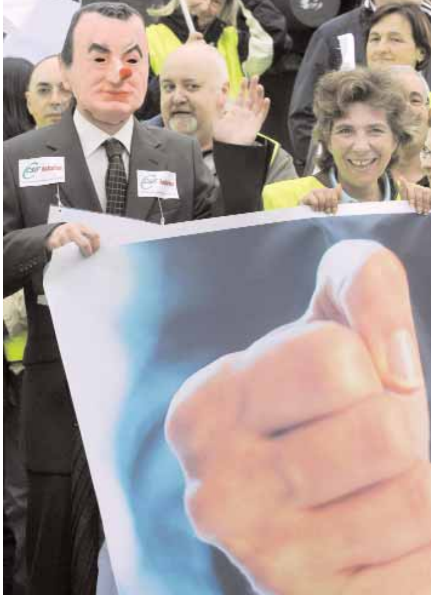
عمال في القطاع العام يضع ادهم قناعاً على هيئة رئيس الوزراء الإسباني ثاباتيرو خلال احتجاجات وسط مدينة أوفيدو الأسبانية ضد خطط التقشف أمس الأول