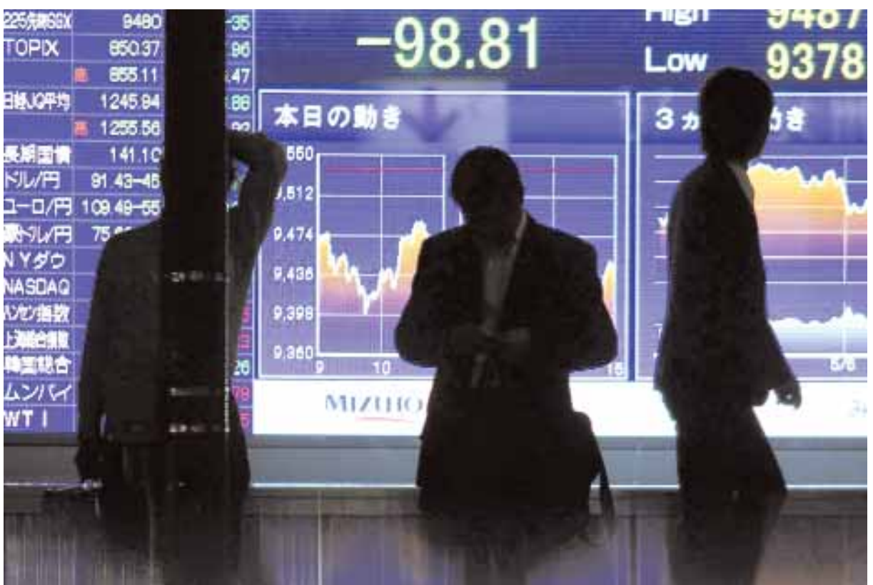
مشاة يعرون امام لوحة الكترونية تعرض سعر إغلاق مؤشر نيكاي في طوكيو امس والذي سجل هبوطا الى ادنى معدلاته في ستة أشهر في ظل مخاوف المستثمرين من أزمة الديون في أوروبا