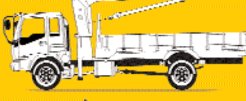
شاحنة برافعة أثقال