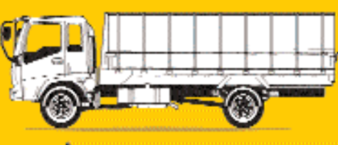
شاحنة حمولات متعددة الأغراض