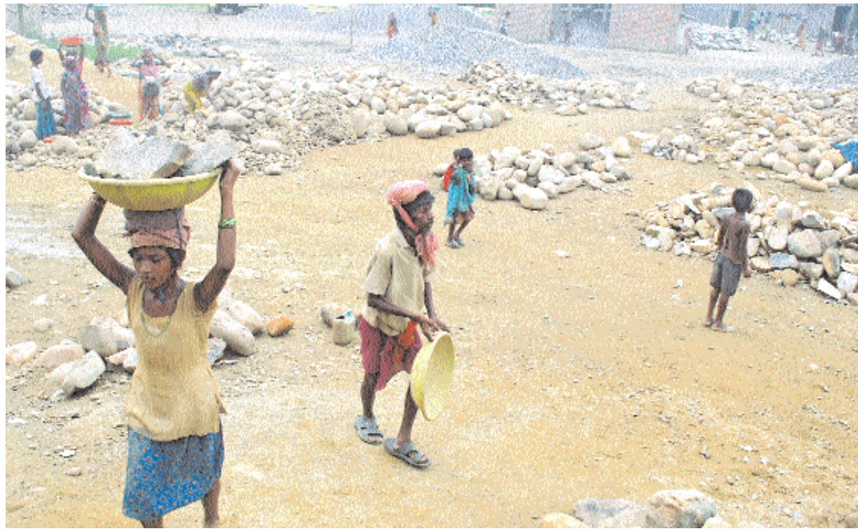
فتاة هندية (يسار) تعمل في محجر شمال ولاية ناجالاند امس في اليوم العالمي لمكافحة عمل الأطفال الذي أعلنته منظمة العمل الدولية منذ عام ٢٠٠٢ لتسليط الضوء على عمل الأطفال وحرمانهم من تلقي التعليم والرعاية الصحية والحريات الاساسية

معدلاته الحالية، والبالغة ١٢ ألف برميل يوميا، إلى ٥٠ ألف برميل في اليوم في إطار برنامج يتضمن محطة عزل غاز الناصرية من ثلاثة آبار محفورة. وتابع بالقول: "من المؤمل ربط بئرين آخرين لرفع إنتاج الحقل وحفر ٢٠ بئرا إضافية من قبل شركة الحفر الوطنية والتي من المتوقع أن تبدأ عملها خلال الأشهر الثلاثة المقبلة فضلا عن مد أنابيب وتحسين منظومة الضخ ومضخات النفط وتحسين العزل بإضافة عازل آخر وتحسين منظومة الطاقة الكهربائية". وقال المهندس عماد الباقير، مدير إدارة الحقول، لوكالة الأنباء الألمانية (د.ب.أ) إن "عمليات الضخ الأولية بدأت فجر أمس وستتسارع لتصل إلى مستوياتها السابقة البالغة ٤٥٠ ألف برميل". وكان الخط الناقل للنفط باتجاه ميناء جيهان قد تعرض قبل خمسة أيام لعمل تخريبي بالقرب من قرية أربيله قرب منطقة الشرايط بين مدنتي كركوك والموصل، ما أدى إلى توقف الضخ بالكامل.