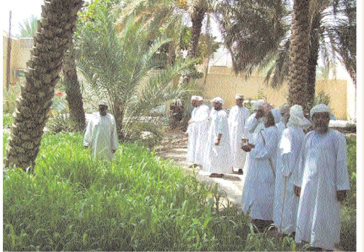
المواطنون خلال عمليات الطناء

للكثير من المشتريين لسد احتياجاتهم فيما يرى البعض بأنها رخيصة نوعا ما وذلك لما تتطلبه النخيل من رعاية وعناية ومتابعة وخاصة في ظل تقلب أسعار المياه وارتفاعها في فصل الصيف.