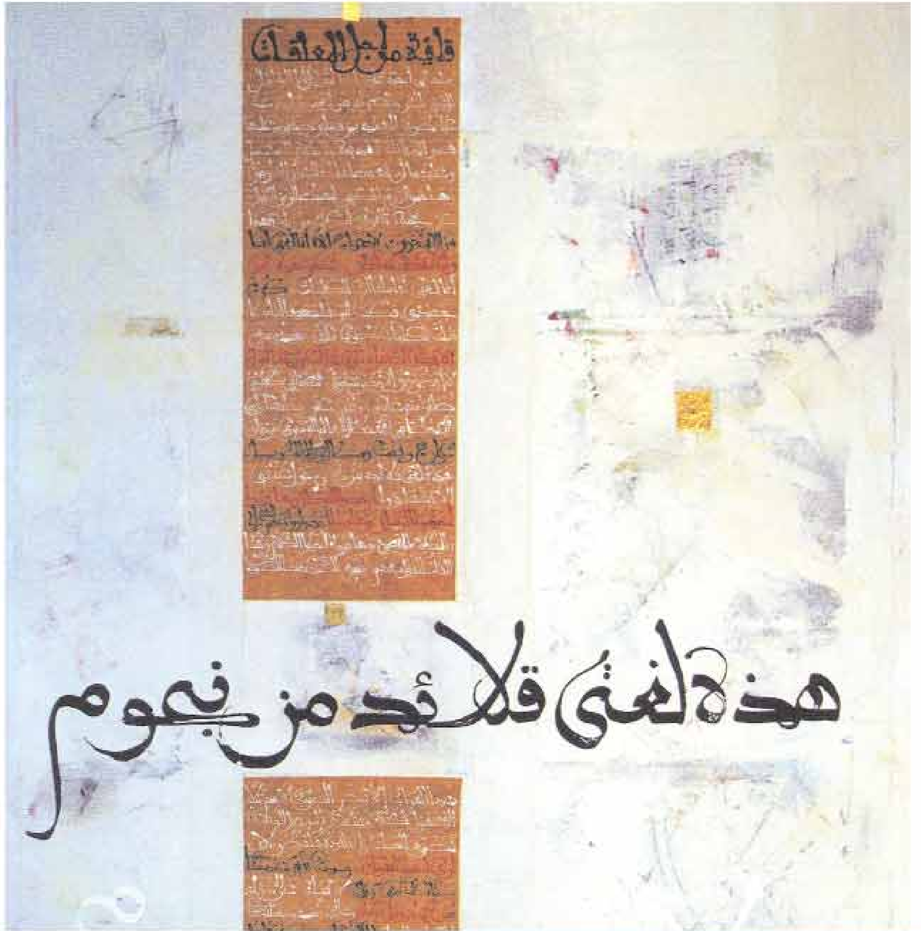
■ اللوحة للفنان عبدالله عكار