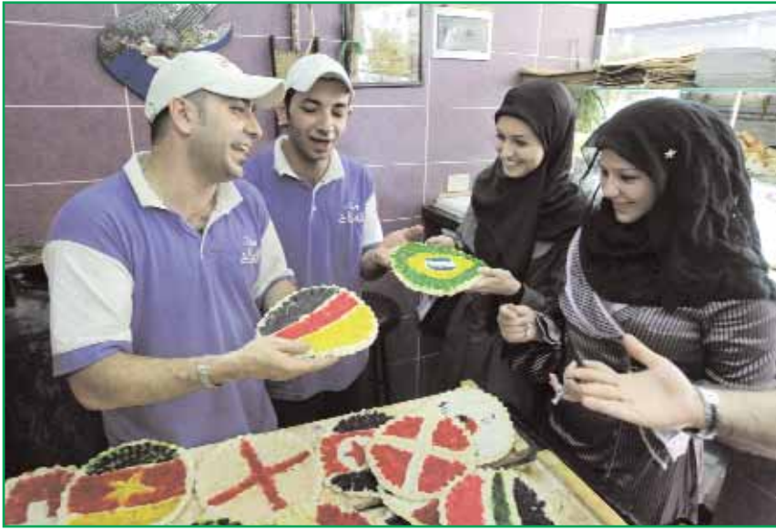
■ زبائن يعاينون الخبز اللبناني التقليدي المغطى بالجبن والمزين بأعلام الدول المشاركة في كأس العالم بجنوب افريقيا وذلك في أحد المحابر ببيروت أمس الأول