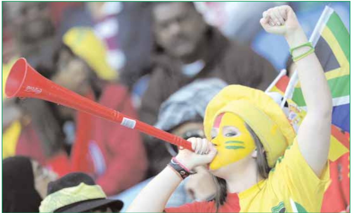
■ مشجعة أسبانية تنفخ في (الفوفوزيلا) خلال مباراة اسبانيا وسويسرا