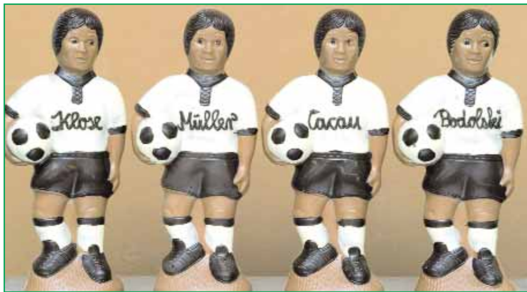
■ تماثيل من الشيكولاته للاعبين الالمان كلوزة ومولر وكاكوا ولوكاس معروضة في مصنع الشيكولاته والحلوى بهورنو شرق ألمانيا امس الأول