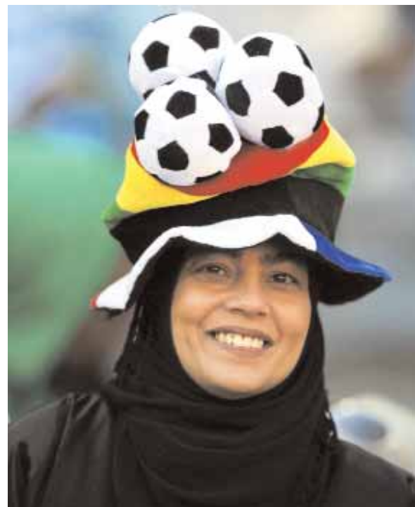
■ مشجعة تنتظر انطلاق مباراة الأرجنتين وكوريا الجنوبية في جوهانسبرج امس

■ جوهانسبرج - رويترز: تلقى الاسترالي تيم كاهيل امس اقل عقوبة ممكنة بإيقافه مباراة واحدة بعد حصوله على بطاقة حمراء مباشرة في مباراة منتخب بلاده امام ألمانيا مما سيجب له الفرصة لخوض المباراة الاخيرة في المجموعة الرابعة لنهائيات كأس العالم لكرة القدم امام صربيا. وسيغيب كبير هدافي المنتخب الاسترالي عن مباراة الغد امام غانا التي يجب ان تتعادل فيها استراليا على الاقل ليكون لها فرصة حقيقية للاستمرار في البطولة. ومنيت استراليا بالهزيمة ٤-٠ صفر امام ألمانيا حيث طرد كاهيل بسبب ارتكابه خطأ مع باستان شفاينشتايجر في مستهل الشوط الثاني. ■