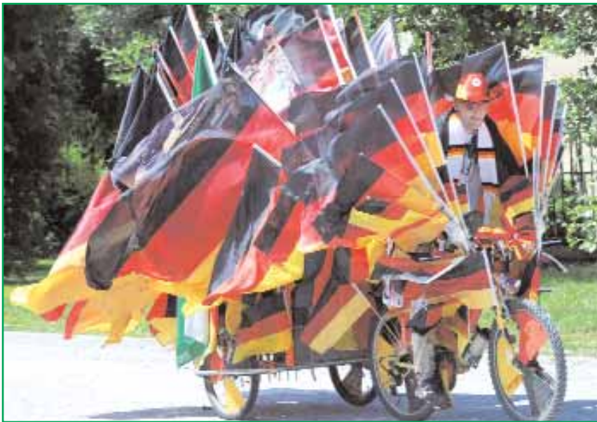
■ مشجع كروي الماني يقود دراجته المزودة بأعلام ألمانيا في ديوسلدورف غرب ألمانيا أمس الأول