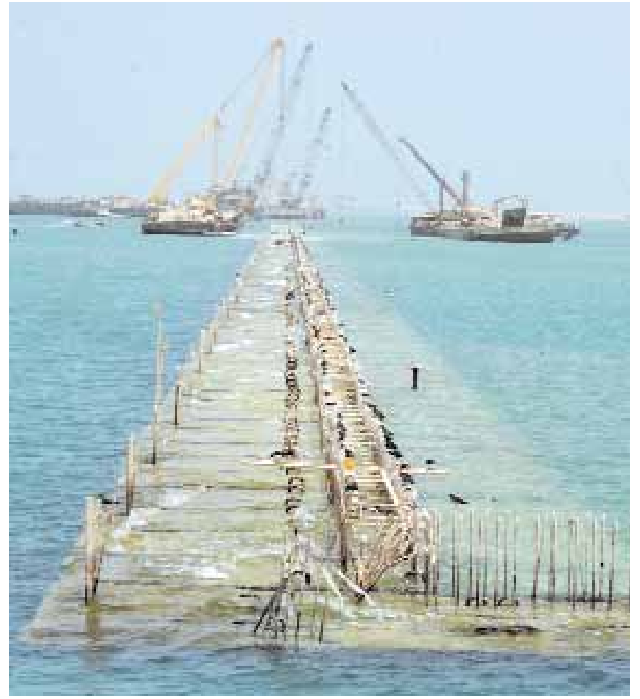
المحطة ستوفر الطاقة الكهربائية لميناء الدقم والمناطق المجاورة للولاية