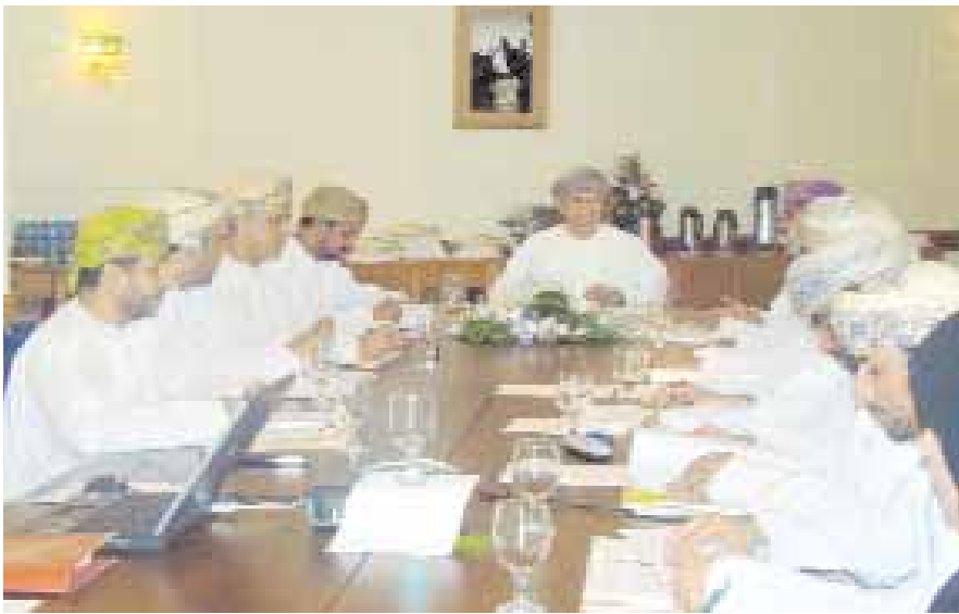
لجنة تطوير صحار اثناء اجتماعها امس

اللجنة عدة مواضيع خدمية وتنموية أهمها دراسة خصخصة قطاع الصرف الصحي والمواضيع السياحية في الولاية وأهمية تفعيلها وذلك بالتنسيق مع الجهات المختصة في هذا الشأن. كما ناقشت اللجنة وضع اسس تسعيرة سيارات الأجرة في الولاية بالإضافة الى ما توصلت اليه نتائج الدراسة الاولية للخارطة الهيكلية والجاري تنفيذها حاليا، واجازت اللجنة بعض المشاريع الاستثمارية تمهيدا لرفعها الى الجهات المختصة، وناقشت اللجنة أيضاً بعض الموضوعات المدرجة على جدول الاعمال والمواضيع المستجدة واتخذت بشأنها القرارات والتوصيات اللازمة.