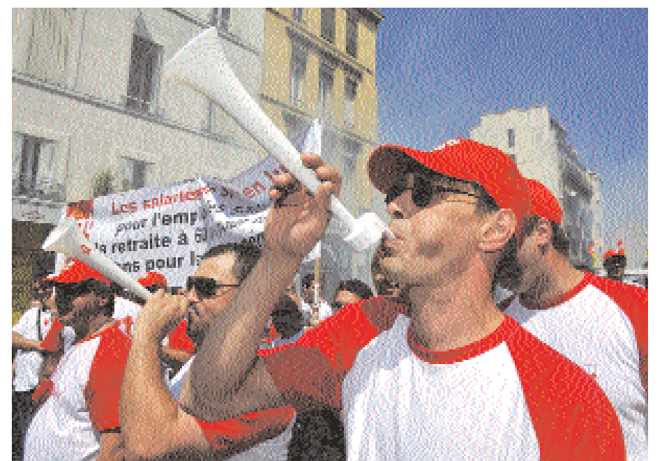
■ فرنسيون ينفخون الفوفوزيلا أثناء مظاهرة في شوارع مدينة مارسيليا جنوب فرنسا أمس خلال اضراب عام في مختلف المدن الفرنسية دعت إليه نقابات العمال احتجاجاً على مشروع الحكومة الفرنسية لإصلاح نظام التقاعد. وسوف يتم التصويت على هذا المشروع، الذي يقضي برفع سن التقاعد من ٦٠ إلى ٦٢ عاماً، خلال شهر سبتمبر المقبل.