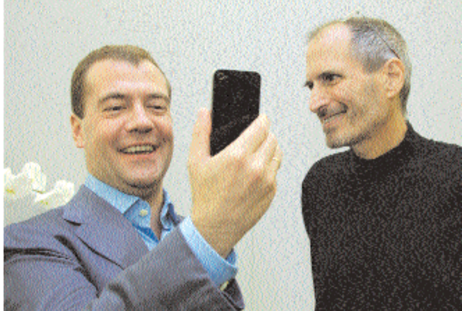
■ الرئيس الروسي دميتري ميدفيديف (يسار) يبتسم بعد تسلمه جهاز آي فون ٤ من ستيف جوبز، الرئيس التنفيذي لشركة آبل خلال زيارته لمنطقة سليكون فالي، المتخصصة في إنتاج البرمجيات على هامش زيارته إلى الولايات المتحدة مؤخرا.

■ باريس - أ.ف.ب: تأثرت الدوائر العامة ووسائل النقل أمس الخميس في فرنسا في مستهل يوم من الاضرابات والتظاهرات احتجاجاً على مشروع حكومي لإصلاح قانون التقاعد. وتم التزام الإضراب الذي دعت إليه كبرى النقابات الفرنسية خصوصا في القطاع التعليمي. وشهدت وسائل النقل اضطرابا كبيرا، وخصوصا في القطارات السريعة المتجهة من باريس إليها وتلك التي تعمل على خطوط دولية. وبالنسبة إلى مترو الاتفاق في باريس فإن ستين في المائة من الخطوط ستظل تعمل. وعلى صعيد وسائل الاعلام، لم تبت