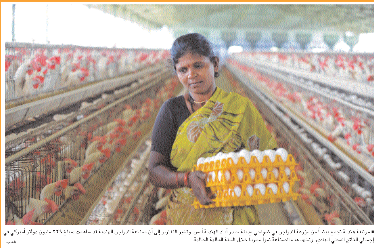
موظفة هندية تجمع بيضاً من مزرعة للدواجن في ضواحي مدينة حيدر أباد الهندية أمس. وتشير التقارير إلى أن صناعة الدواجن الهندية قد ساهمت بمبلغ ٢٢٩ مليون دولار أميركي في إجمالي الناتج المحلي الهندي. وتشهد هذه الصناعة نمواً مطرداً خلال السنة المالية الحالية.