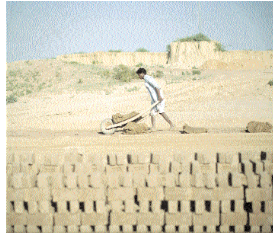
■ عامل باكستاني ينقل طميا فوق عربة يد في موقع لحرق الطابوق بضواحي روالبيندي في ٢٦ يونيو ٢٠١٠. ويزيد عدد القوى العاملة في باكستان على ٤٥ مليون شخص من بين عدد السكان الاجمالي ١٥٠ مليون نسمة وفقا لتقارير اقتصادية حكومية

■ لندن - رويترز: ارتفع سعر الذهب في أوروبا أمس الاثنين مقتربا من ارتفاعه القياسي الذي سجله الأسبوع الماضي مع استمرار المخاوف بشأن قوة انتعاش الاقتصاد العالمي. وسجل سعر الذهب في السوق الفورية ١٢٥٤,٢٥ دولار للأوقية بالمقارنة مع ١٢٥٣,٤٠ دولار في نيويورك يوم الجمعة الماضي. واقترب السعر من مستواه القياسي فوق ١٢٦٤ دولارا للأوقية الذي سجله الأسبوع الماضي وتوقع المحللون أن تكون هناك فرصة لتجاوزه هذا الأسبوع. وبلغ سعر الفضة ١٩,٠٩ دولار للأوقية مقارنة مع ١٩,٠٤ دولار يوم الجمعة في نيويورك. وسجل سعر البلاتين ١٥٧٨,٩٠ دولار للأوقية ارتفاعا من ١٥٦٦,٥٠ دولار. وارتفع البلاديوم قليلا إلى ٤٧٦,٤٣ دولار للأوقية من ٤٧٤,٥٠ دولار. ■