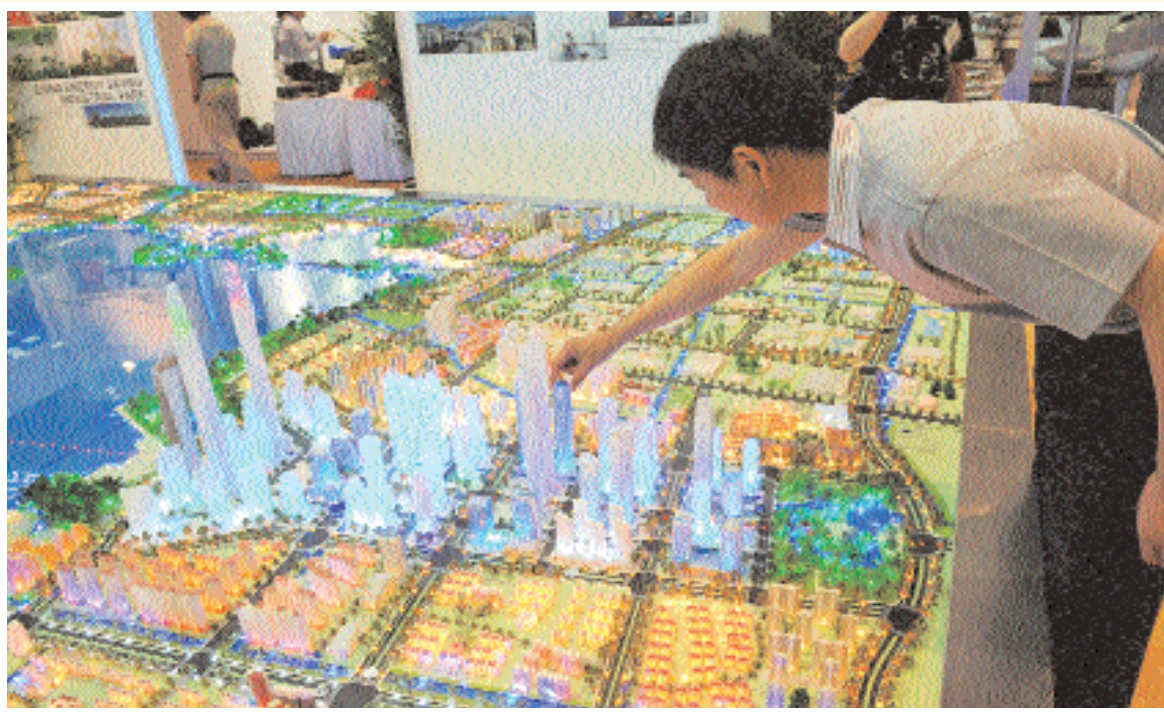
■ أحد العارضين يضبط مجسما معماريا في معرض قمة مدن العالم في سنغافورة أمس. ويقدم المعرض أحدث الحلول المبتكرة للمدن في المستقبل وجذب اليه نحو ٥٠ شركة ووكالة مشاركة ويتوقع ان يصل زائروه في الفترة من ٢٩ يونيو الى ١ يوليو حوالي ٢ آلاف زائر ا ف ب

■ سنغافورة - دب.أ. قال مجلس السياحة في سنغافورة أمس الاثنين إن عدد السياح إلى سنغافورة نما بنسبة ٣٠٪ في مايو مقارنة بالشهر نفسه من العام الماضي ليصل إلى ٩٤٦ ألف سائح في رقم قياسي للشهر السادس على التوالي. وقال المجلس إن إجمالي إيرادات الغرف في فنادق سنغافورة ارتفع بنسبة ٤٥٪ في مايو مقارنة بالشهر ذاته قبل عام ليصل إلى ١٦٤ مليون دولار سنغافوري (١٠٥ مليون دولار أميركي). وبلغ معدل إشغال الغرف في المتوسط ٨٥٪ في مايو بزيادة قدرها ١٧٪ نقطة مئوية عما كان عليه قبل عام. وكان قطاع السياحة في سنغافورة قد أصيب بشدة جراء الركود العالمي لكنه تلقى دفعة هذا العام بافتتاح منتجعين ترفيهيين بقيمة بلغت عدة مليارات الدولارات.