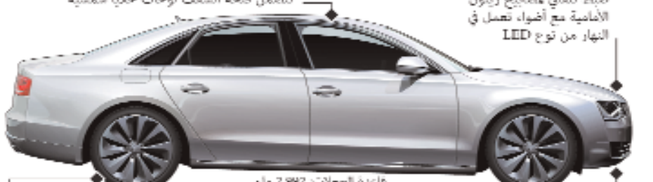
الحركات، بزبون 4.2 لتر دشان اسطوانات V8، ٧.٨ ديزل 3.0 لتر بست اسطوانات V6، ٧.٨ ديزل 3.0 لتر توربوديزل 3.0 لتر

أودي نجد صعوبة في تلبية الطلب على سيارتها A8. تشمل التكنولوجيات الرائدة المزود بها هذا الطراز مستشعرات ميكرو تستخدم أجهزة استشعار رادارية، وكاميرا للتصوير الحراري من أجل التعرف على المخاطر وتحديدها في وقت مبكر واتخاذ التدابير الوقائية اللازمة