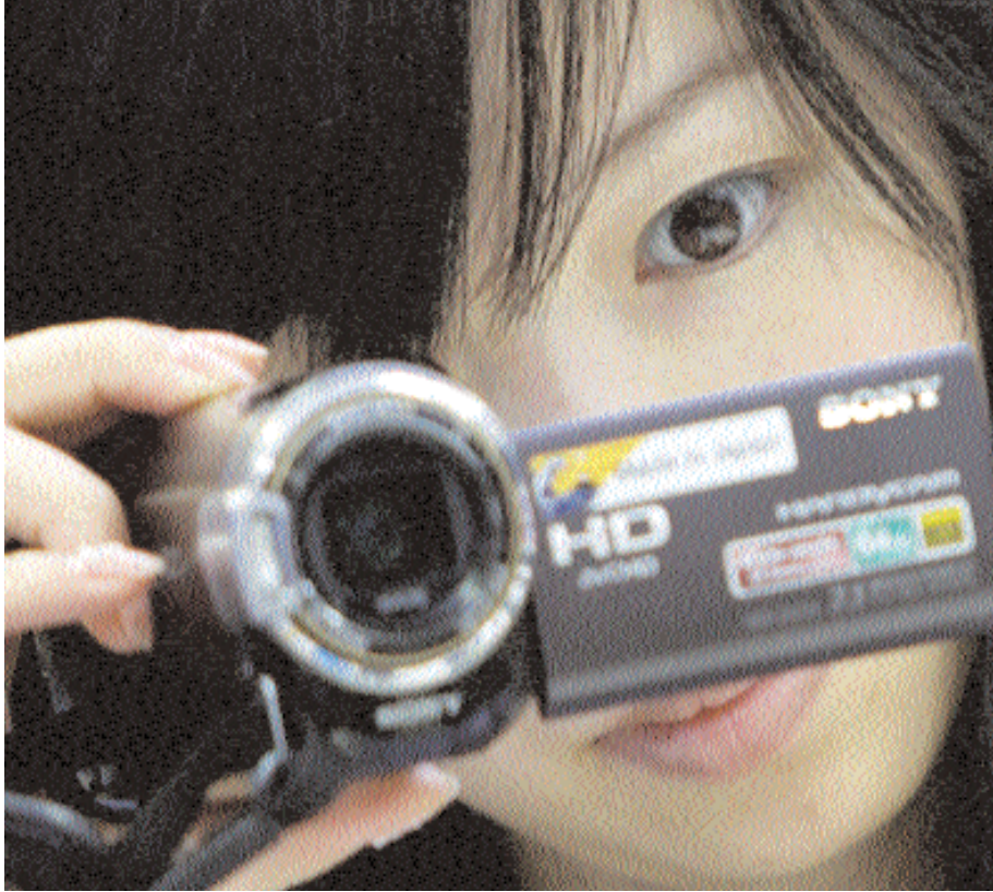
سائحة صينية تجرب كاميرا فيديو في متجر بالسوق الحرة في ضاحية أكهيابارا بالعاصمة اليابانية طوكيو أمس.

القادم. وأوضح أن سكان الاقاليم الوسطى يزعمون الأرز ليس بغرض التصدير، ولكن للاستهلاك الخاص، وحرز من أن مواطني المنطقة ربما لا يكون لديهم ما يكفي لتغطية استهلاكهم من الأرز. وأفادت تقارير صحفية محلية أن مستويات المياه في النهار والخزانات في المنطقة تقل بما يتراوح بين نصف متر ومتر عما كانت عليه في هذا الوقت من العام الماضي، مع استنزاف العديد من الخزانات إلى حد جعل عمليات الري في كثير من المناطق امرا مستحيلا. في الوقت نفسه، يؤدي الجفاف الممتد منذ فترة طويلة إلى اشتعال حرائق الغابات، مما أدى لاحتراق مئات الهكتارات. ■