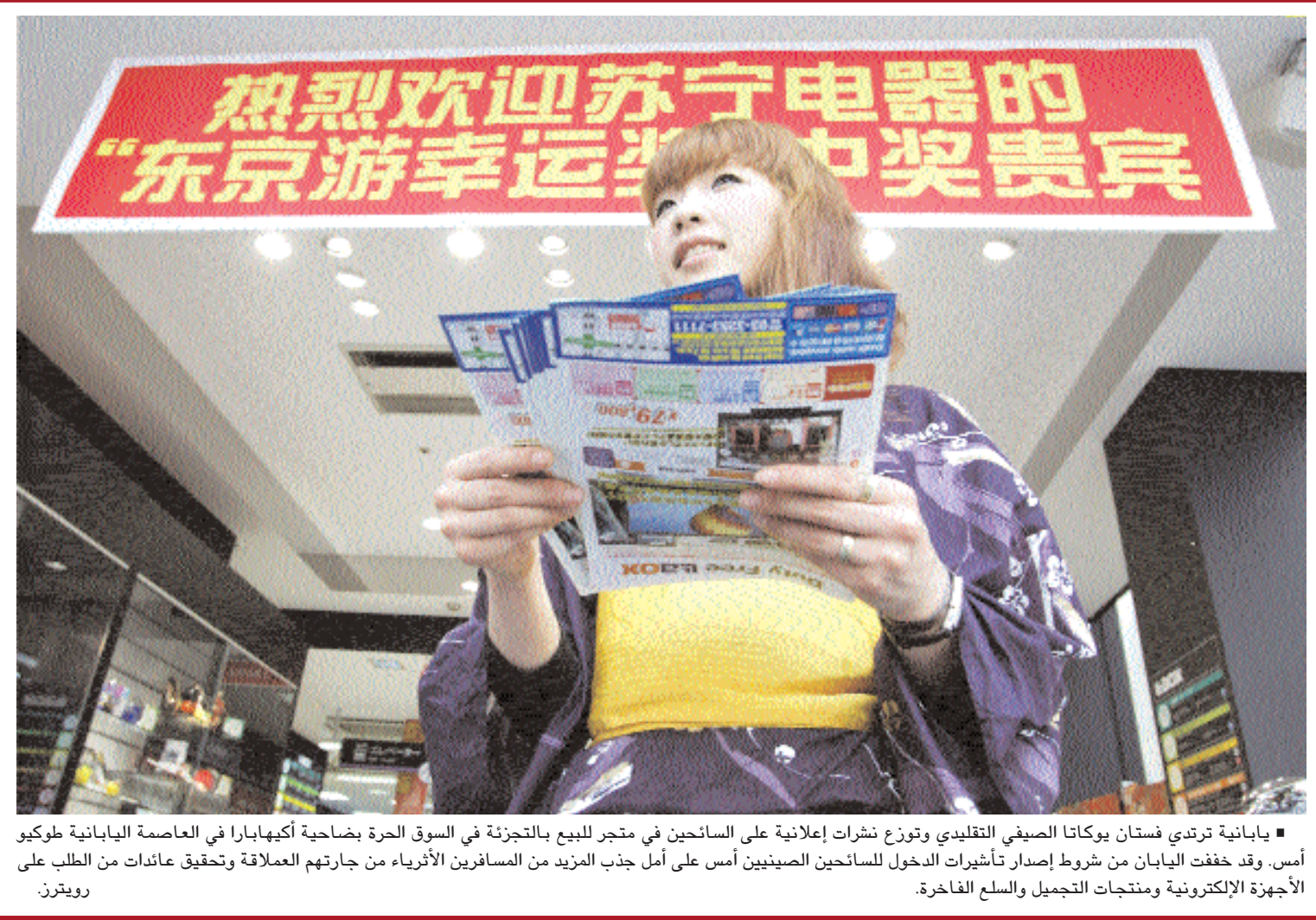
يابانية ترتدي فستان يوكاتا الصيفي التقليدي وتوزع نشرات إعلانية على السائحين في متجر للبيع بالتجزئة في السوق الحرة بضاحية أكهيابارا في العاصمة اليابانية طوكيو أمس. وقد خففت اليابان من شروط إصدار تأشيرات الدخول للسائحين الصينيين أمس على أمل جذب المزيد من المسافرين الأثرياء من جارتهم العملاقة وتحقيق عائدات من الطلب على الأجهزة الإلكترونية ومنتجات التجميل والسلع الفاخرة.