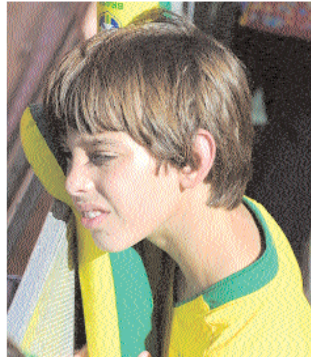
■ طفل برازيلي حزين بعد خسارة فريقه من هولندا أ ف ب