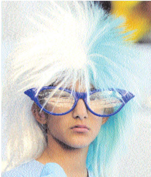
■ مشجعة أرجنتينية تنتظر بداية مباراة فريقها مع ألمانيا