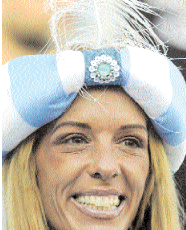
■ مشجعة أرجنتينية تنتظر انطلاق مباراة الأرجنتين وألمانيا