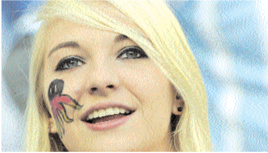
■ مشجعة المانية تنتظر انطلاق مباراة ألمانيا والأرجنتين أ ف ب