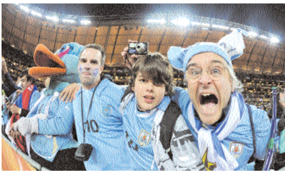
■ مشجعون أوروغويونون يحتفلون بفوز أوروغواي على غانا أ ف ب

■ جوهانسبرج - د. ب. أ. أشاد الاتحاد الدولي لكرة القدم بمعدل الحضور الجماهيري لمباريات كأس العالم ٢٠١٠ لكرة القدم في جنوب إفريقيا. وقال بيكا أوردوبوزولا، المتحدث باسم الفيفا إن متوسط الحضور الجماهيري لكل مباراة وصل إلى ٥٠ ألف مشجع وهو واحد من أعلى معدلات الحضور الجماهيري التي حدثت في البطولات السابقة. وأضاف أوردوبوزولا أنه رغم أن المباريات شهدت في الفترة الأخيرة نقصا في الحضور الجماهيري، إلا أن الفيفا يرى أنه ثمة تحول إيجابي على مستوى العالم في المتابعة الجماهيرية، إذ وصل إجمالي عدد زائري المونديال إلى ١٤ مليون شخص.