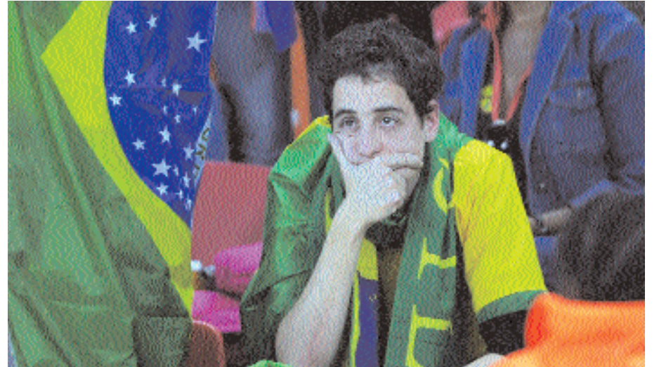
■ مشجع برازيلي حزين بعد انتهاء مباراة فريقه مع هولندا