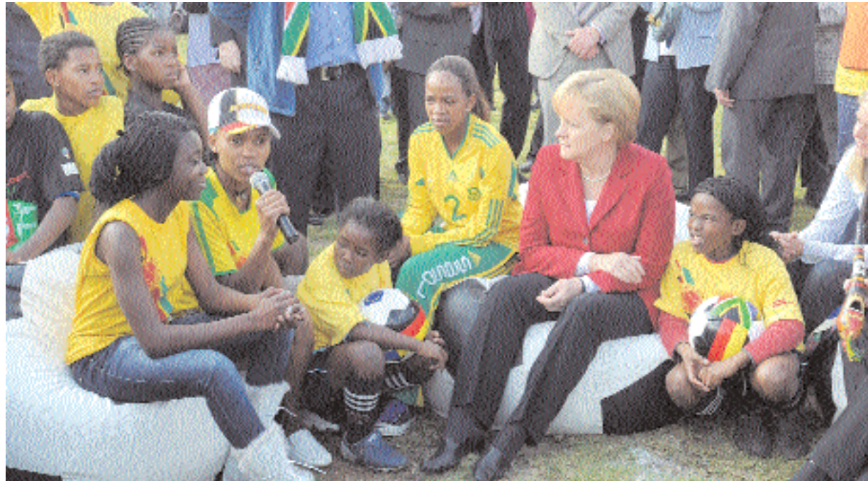
■ المستشارة الألمانية أنجيلا ميركل تستمع إلى لاعبات كرة قدم ناشئات في إطار جولة لها أمس لتفقد مشروعات تنمية رياضية في جنوب أفريقيا بدعم وتمويل من الحكومة الألمانية