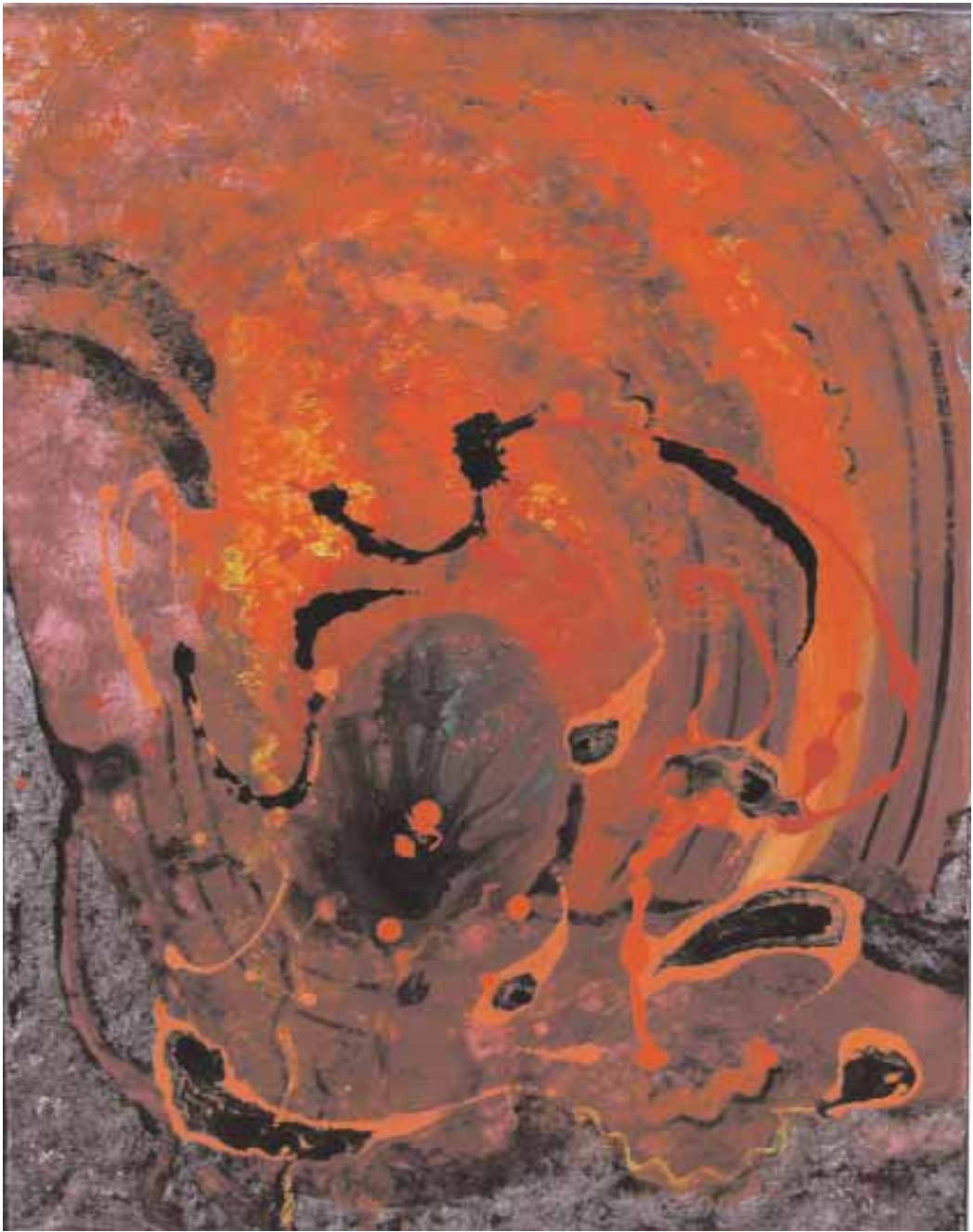
■ اللوحة للفنانة سناء الحموي

عزيزي القارئ أهلاً وسهلاً بك في نافذة لغوية جديدة نخرج من خلالها على معاني أسمائنا، فهل سبق لك أن تعرفت معنى اسمك؟ وهو الكثير البين، وكذلك البينين التي يعني أيضاً: البعيد، وأخف وهو المدحج البرلين إلى البديل، وأشعب أي ذو متكين أحدهما بعد عن الآخر، وأشعب من طرفاء العرب المشهورين، والبخري تصعب لنا عن بعض منهم وقهيم وما يدور في أذهانهم وأسم الشاعر المعروف الحلبيّة يعني أيضاً القصير والقصيح الوجه، ومن الأسماء في معنى القصر بعد: خنيزر وخنّزر وحنّزل وهو القصير الضخم البطن.