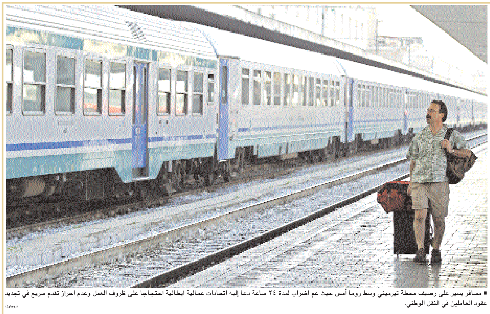
مسافر يسير على رصيف محطة تبريميبي وسط روما أمس حيث عم اضراب لمدة ٢٤ ساعة دعا إليه اتحادات عمالية إيطالية احتجاجا على ظروف العمل وعدم احراز تقدم سريع في تجديد عقود العاملين في النقل الوطني.