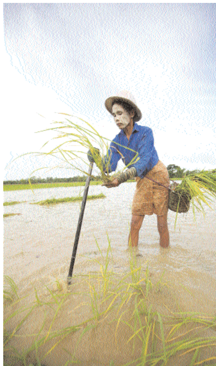
مزارعة تزرع شتلات الأرز في حقل بضواحي بانجون - ميانمار أمس وتضع على وجهها كريما تقليديا لحمايته مصنوعا من الخشب.

أكدت دراسة شركة التأمين أن الأسباب والأمراض النفسية تأتي في المرتبة الرابعة ضمن قائمة أسباب غياب العمال والموظفين عن العمل، حيث مثلت وحدها خلال العام نسبة ٨٦٪ من حالات الغياب، مقابل نسبة ٨٣٪ في عام ٢٠٠٨.