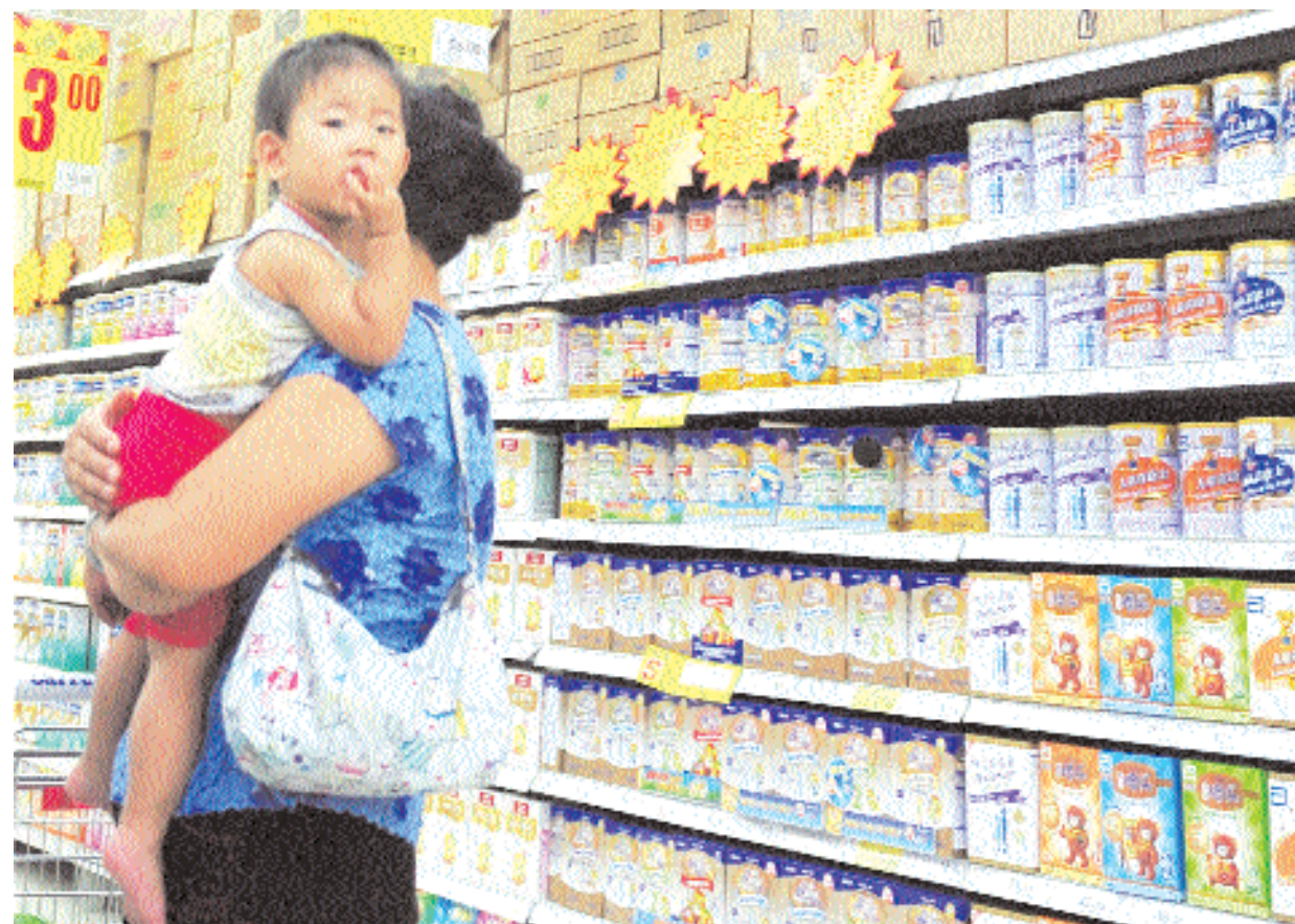
صينية تختار حليب بودرة لطفلها في محل بقالة في بكين أمس. وقد صادرت السلطات الصينية ٧٦ طنا من حليب البودرة الملوث بالميلامين وهو نفس المركب الكيميائي المسؤول عن وفيات ٦ أطفال قبل سنتين.