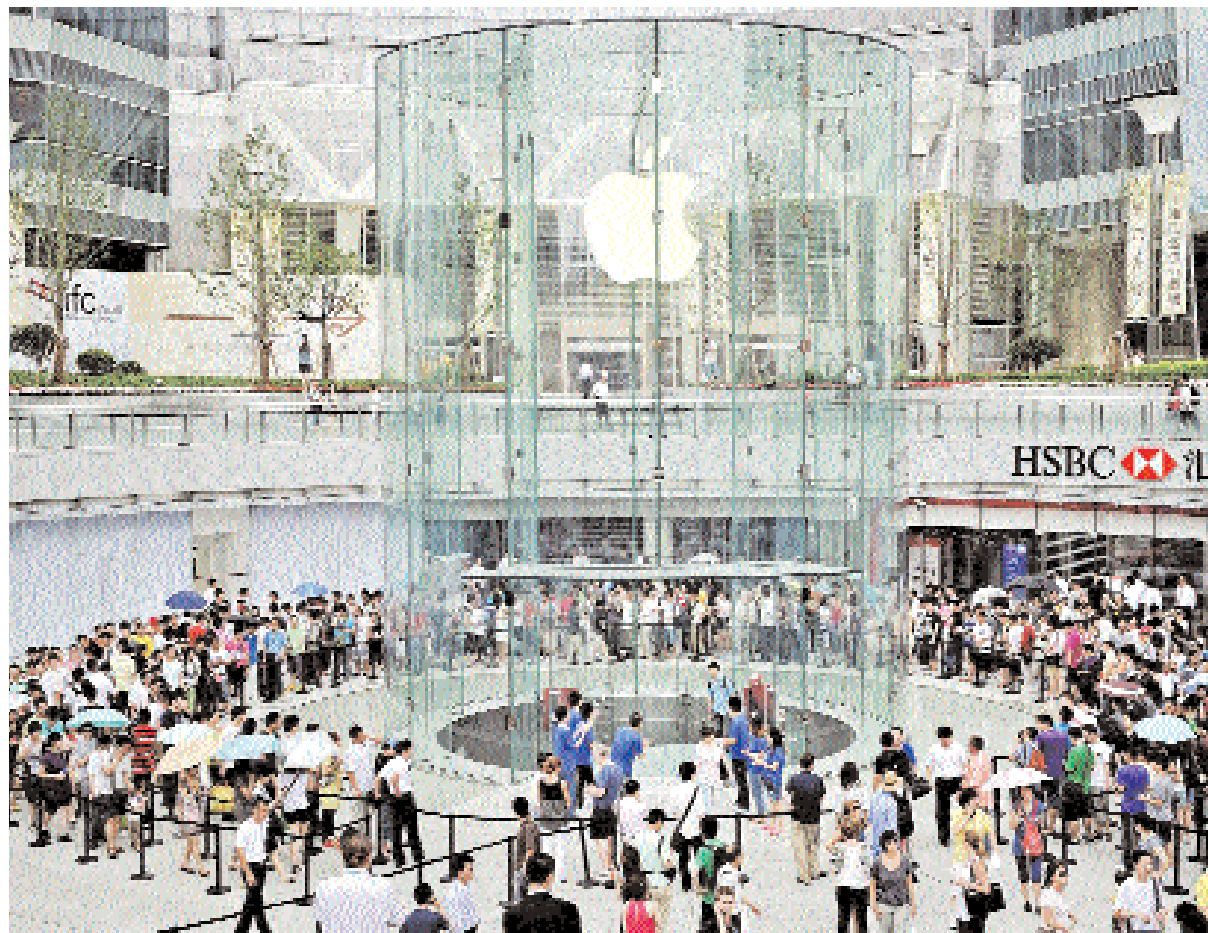
زبائن داخل المتجر الجديد لأبل في شنغهاي أمس حيث افتتحت أبل متجرها الثاني في الصين في حي يودونغ المالي