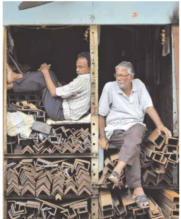
تجار يأخذون قسطا من الراحة في سوق لبيع الحديد بالجملة في مدينة كلكتا الهندية أمس.

■ أضاف مؤشر سوق مسقط للأوراق المالية في جلسة تداولات أمس التي اختتمت جلسات الأسبوع أكثر من نقطتين ليغلغ المؤشر مرتفعا عند مستوى الستة آلاف و٢١٧ نقطة، حيث جاء هذا الارتفاع نتيجة لدعم مؤشرات جميع القطاعات. وبلغ حجم التداول أكثر من ٤ ملايين و٤٠٠ ألف ريال عماني وذلك عن تداول أكثر من ١٠ ملايين و٨٨٠ ألف سهم فيما بلغ عدد الصفقات المنفذة ٢١٨٦ صفقة. وعلى صعيد الشركات فقد تم التداول بأسهم ٥٢ شركة ارتفعت مع نهاية الجلسة أسعار ٢٢ شركة وانخفضت أسعار ٨ شركات فيما حافظت أسعار ١٢ شركة على مستوياتها السابقة. وكانت أبرز الارتفاعات لشركة ظفار للسياحة والتي ارتفع سعر سهمها أكثر من ٦ بالمائة ليغلغ عند ريال و٩ بيسات كما ارتفع سهم شركة الجزيرة للصناعات الحديدية ١٦ بيسة وأغلغ عند ٣١٦ بيسة وأضاف سهم شركة صفاء الكابلات ٥٥ بيسة إلى سعره وأغلغ عند ريال و١٧٩ بيسة كما أضفت شركة صفاء للأغذية ١٤ بيسة إلى سهمها ليغلغ سعرها عند ٣٠٩ بيسات. ■ تفاصيل.....ص٨