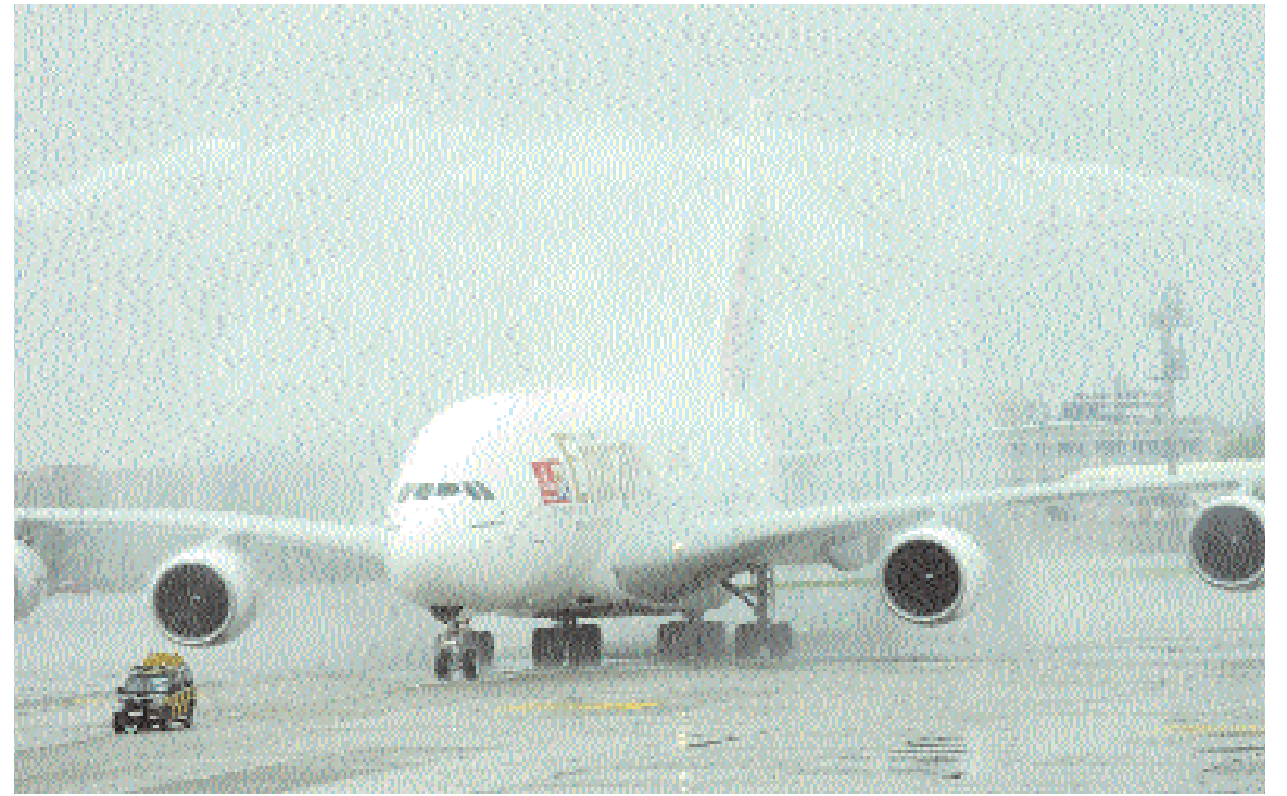
■ عمال في محطة الوصول رقم ٣ بمطار أنديرا غاندي في العاصمة الهندية نيودلهي يحبون طائرة إيرباص A380 ، أكبر طائرة ركاب في العالم والتابعة لشركة طيران الإمارات برشها بخراطيم المياه لدى وصول الطائرة العملاقة إلى المحطة . وكانت رحلة EK 516 لطائرة إيرباص A380 أول رحلة تجارية تحط بمحطة الوصول الجديدة بعد يوم بعد افتتاحها .

■ لندن - رويترز: ارتفع سعر الذهب بعض الشيء أمس مدعوماً بتراجع الدولار بشكل عام أمام اليورو واستيعاب المستثمرين لبيانات متباينة عن نمو الاقتصاد الصيني . وعضو اليورو خسائره الكبيرة أمام الدولار أمس بعد أن أشارت البيانات الاقتصادية الصينية إلى تباطؤ بسيط بدلاً من تراجع عميق وغير محكوم كان يخشاه بعض المستثمرين . وفي الساعة ٠٧:٠٠ بتوقيت جرينتش بلغ سعر الذهب في السوق الفورية ١٢٠٩.٩٥ دولار للأوقية (الأونصة) ارتفاعاً من ١٢٠٧.٥٠ دولار عند إقفاله السابق في نيويورك أمس الأول . وكان سعر الذهب قد ارتفع إلى أعلى مستوياته في أسبوع عند ١٢١٧.٨٥ دولار للأوقية أمس الأول . وسجل سعر الفضة في تعاملات اليوم ١٨.٢٥ دولار للأوقية مقارنة مع ١٨.٢٤ دولار . وزاد سعر البلاتين إلى ١٥٢٤ دولاراً للأوقية من ١٥١٩.٥٠ دولار في حين بلغ سعر البلاتينوم ٤٦٣.٥٠ نزولاً من ٤٦٤.٥٠ دولار .