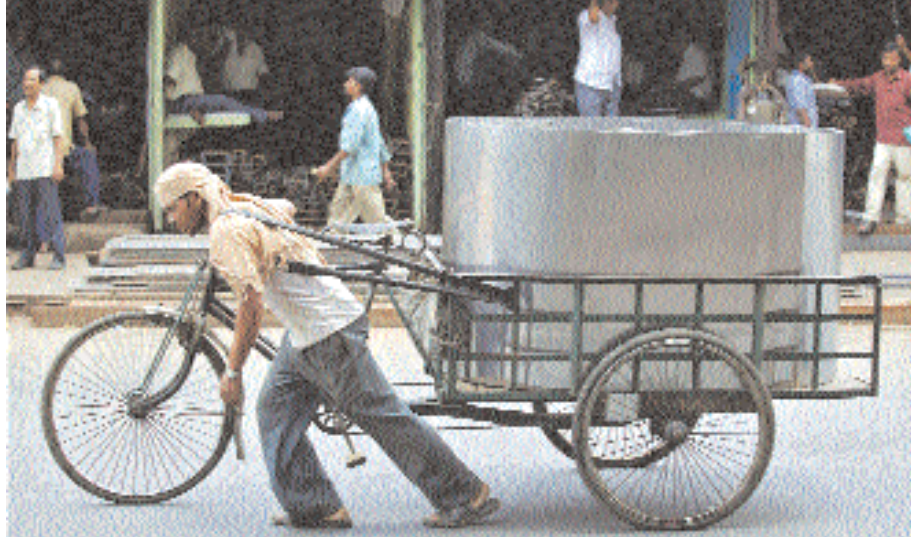
عامل يسحب عربة تقليدية محملة بألواح حديدية في سوق لبيع الحديد بالجملة في مدينة كلكتا الهندية أمس . وتصدر الهند حوالي نصف إجمالي طاقتها الإنتاجية من الحديد الخام بشكل أساسي إلى الصين .

الصين حتى الآن، حيث سيبلغ عدد اجزائها ٥٠ ألفاً هذه السنة . وسيبصر مصنع عاشر النور قريباً في فوشان جنوب البلاد . وكانت فولكسفاغن أعلنت في أبريل زيادة برنامجها الاستثماري في الصين بقيمة ٦.١ مليار يورو بحلول ٢٠١٢ ، ليصبح ستة مليارات يورو . وتشهد فولكسفاغن، الشركة الأوروبية الأولى التي تطمح إلى أن تكون الأولى في العالم، ازدهاراً سريعاً ومطرداً .