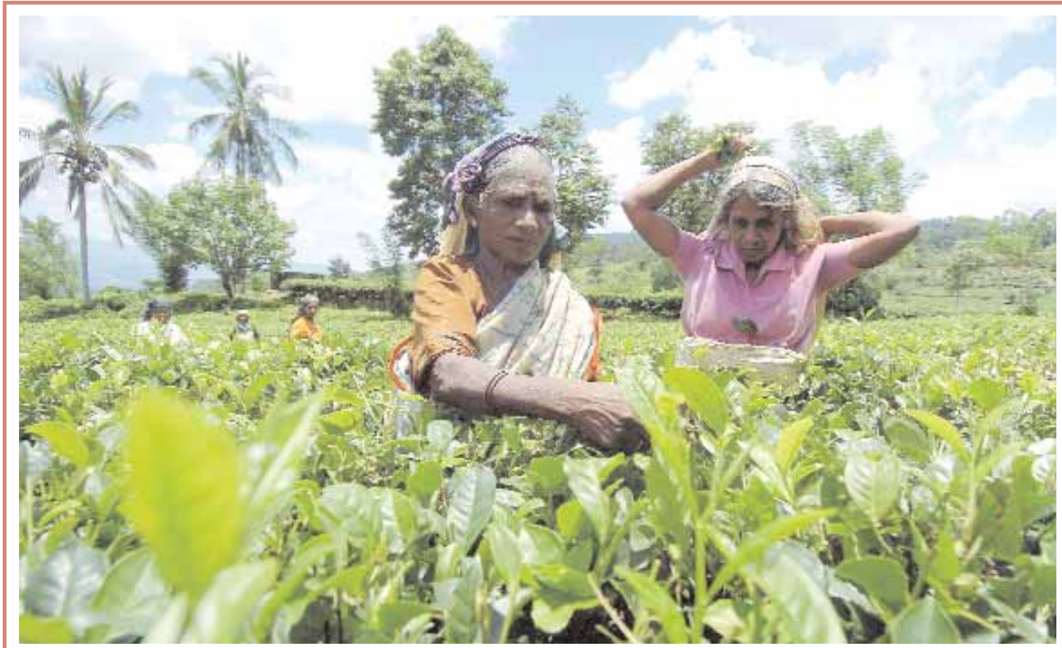
صورة أرشيفية بتاريخ ٨ سبتمبر ٢٠٠٧ لـ نساء يجمعن الشاي في مزرعة بكاني جنوب شرق كولومبو. وقد سجل إنتاج سيرلانكا من الشاي في النصف الاول زيادة بنحو ٣٠٪ إلى ١٦٦ر٩ مليون كيلو مقارنة بالفترة نفسها من العام السابق وتعد سيرلانكا أكبر مصدر للشاي الأسود في العالم.