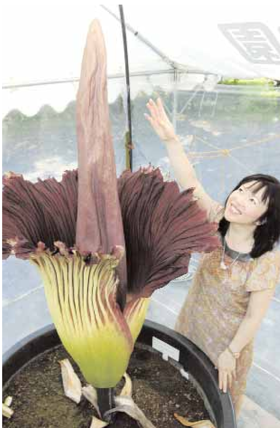
امرأة تتأمل وردة (تيتان اللوف) التي تعد من أكبر الورود الاستوائية وأندرها وذلك في الحديقة النباتية في لويشيكواوا في طوكيو أمس. وهذه هي المرة الأولى التي تزهو فيها الورد في الحديقة منذ حوالي ٢٠ عاما.

موسكو - د.ب.أ: قررت روسيا تكثيف دعائها للمستثمرين الأوروبيين عبر شبكة الإنترنت لاستقطاب أموالهم داخل المشروعات الروسية. وتتفق روسيا حاليا ملايين الدولارات على حملة دعائية على موقع شبكة الإنترنت أطلق عليه "مورن روسيا. كوم" تستعين فيه بخبرات متخصصين أمريكيين في العلاقات العامة للتوصل إلى أفضل أشكال الدعاية لجذب الاستثمارات الأوروبية. وتحاول هذه البوابة الإلكترونية التي تديرها شركة أميركية تغيير صورة روسيا النمطية في ذهن المستثمرين كدولة ينتشر فيها الفساد، ومتعسفة ومعادية للاستثمارات وشديدة البيروقراطية. وقالت إحدى وكالات الاتصالات أمس الخميس