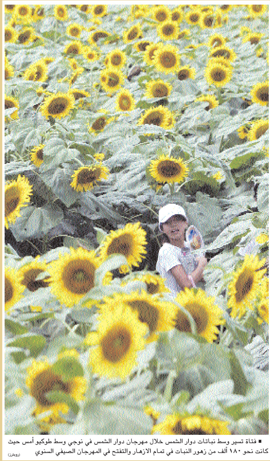
قناة تسير وسط نباتات دوار الشمس خلال مهرجان دوار الشمس في نوجي وسط طوكيو أمس حيث كانت نحو ١٨٠ ألف من زهور النبات في تمام الأزهار والتفتت في المهرجان الصيفي السنوي