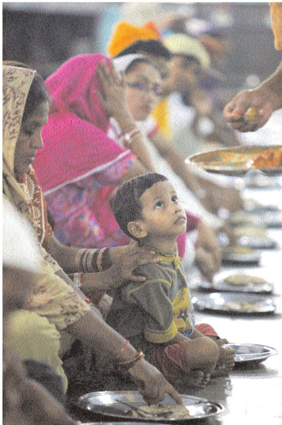
■ صبي ينتظر وجبته في مطعم عام بالضواحي القديمة في العاصمة الهندية نيودلهي أمس. وقد انخفض معدل التضخم الغذائي في الهند بينما ارتفع التضخم في أسعار الوقود خلال منتصف شهر يوليو الجاري. رويترز

■ سينول - رويترز: قالت شركة هيونداي موتور أكبر شركة لصناعة السيارات في كوريا الجنوبية إن أرباحها الفصلية ارتفعت بنسبة ٧٨ بالمئة إلى مستوى قياسي متجاوزاً التوقعات ومدعمة بطلب قوي في الولايات المتحدة والصين. وأعلنت هيونداي التي تمثل مع كيا التي تمتلك فيها حصة كبيرة خامس أكبر منتج للسيارات في العالم تسجيل أرباح صافية بلغت ١.٣٩ تريليون وون (١.١٧ مليار دولار) في الربع الثاني وكان المحللون قد توقعوا أرباحاً تبلغ ١.١ تريليون وون في استطلاع شمل ٢٣ محللاً استطلعت خدمة تومسون رويترز أي/بي/إس/إس آراءهم. ويقارن ذلك مع أرباح قدرها ٨١٠.٩ مليار وون سجلتها الشركة قبل عام والمستوى القياسي السابق البالغ ١.١٣ تريليون وون في الربع الأول من عام ٢٠١٠. وأعلنت هيونداي تسجيل أرباح تشغيل ٨٦٣.٢ مليار وون في الربع المنتهي يوم ٣٠ يونيو متجاوزة توقعات بأن تبلغ ٨٠١.٣ مليار وون. وقد تواجه الشركة صعوبات في النصف الثاني من العام بسبب المخاوف المتعلقة بانتعاش اقتصادات الولايات المتحدة وأوروبا والتي قد تحد من الطلب فضلاً عن ارتفاع أسعار المواد الخام. ومنذ بداية العام ارتفع سهم هيونداي بنحو ٢٠ بالمئة متجاوزاً ارتفاع مؤشر السوق الذي زاد بنسبة خمسة بالمئة.