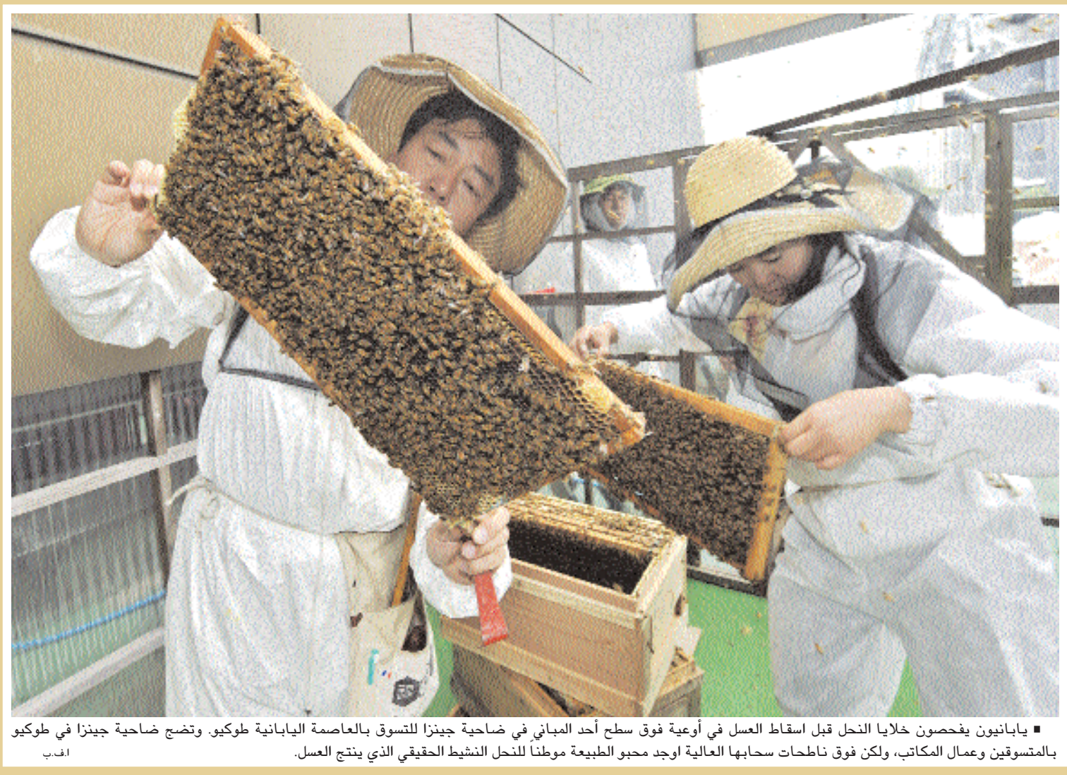
■ يابانيون يفحصون خلايا النحل قبل اسقاط العسل في أوعية فوق سطح أحد المباني في ضاحية جينزا للنسوق بالعاصمة اليابانية طوكيو. وتضخ ضاحية جينزا في طوكيو بالمستوفين وعمال المكاتب، ولكن فوق ناطحات سحابها العالية اوجد محبو الطبيعة موطننا للنحل النشط الحقيقي الذي ينتج العسل.