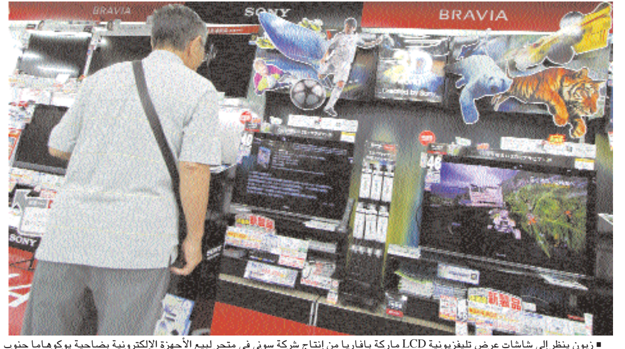
■ زبون ينظر إلى شاشات عرض تلفزيونية LCD ماركة بافاريا من إنتاج شركة سوني في متجر لبيع الأجهزة الإلكترونية بضاحية يوكوهاما جنوب العاصمة اليابانية طوكيو. وقد حققت شركة سوني أرباحاً تشغيلية غير متوقعة خلال الربع الثاني من العام الحالي بفعل تحسن الطلب على الأجهزة الإلكترونية والتخفيضات الحاسمة في تكلفة الإنتاج.