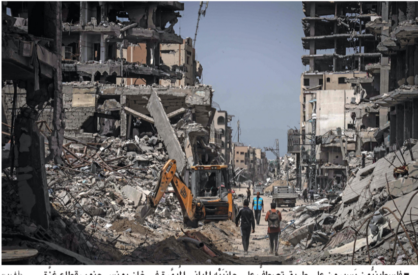
فلسطينيون يسرون على طريق تصطف على جانبيه المباني المدمرة في خان يونس جنوب قطاع غزة.

مسقط - العُمانية: استقبل معالي السيد بدر بن حمد البوسعيدى وزير الخارجية أمس معالي الدكتور عبد اللطيف بن راشد الزياني وزير خارجية مملكة البحرين الشقيقة، في إطار الزيارة الرسمية التي يقوم بها حالياً إلى سلطنة عُمان.