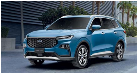
فورد تيريتوري مجهزة بأربعة أوضاع في القيادة

٣٢٠ نيوتن متر باستخدام قود معتدل وقوة مذهلة تصل إلى ١٩٠ حصانا كما أن السيارة مزودة بقباض مزجج متطور ونائل حركة ألي من سبع سرعات يوفر نقلا سلسا وسريع الإستجابة مع كفاءة استثنائية في استهلاك الوقود. وتأتي السيارة مجهزة بأربعة أوضاع القيادة وذلك لتزويد العملاء بالقدرة على تخصيص تجربة القيادة الخاصة بهم كما أنها تحتوي على مجموعة من تقنيات مساعدة السائق التي توفر أقصى درجات الأمان وتعزز تجارب القيادة للعملاء حيث تتيح السيارة للعملاء القيادة بثقة من خلال تقديم مجموعة رائعة من ميزات السلامة المتوفرة والمعروفة باسم فورد Co-Pilot كما تشمل على تقنيات الأمان ونظام الحماية من السرقة لضمان السلامة المطلقة للسائقين والركاب.