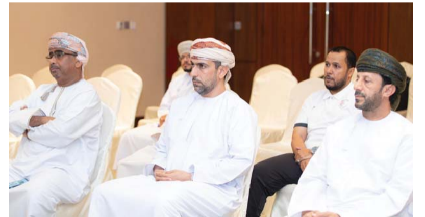
من حضور المؤتمر

الأولى على مستوى الأندية والمراكز الرياضية والولايات، والثانية على مستوى المحافظات، والثالثة على مستوى السلطنة، وأكد العلوي خلال المؤتمر الصحفي الذي عقد بفندق راديسون بانوراما عن تطلعه لنجاح النسخة الأولى للمسابقة، مشددًا على قيمتها النوعية، وجدوى مخرجاتها الفنية الرامية لتعزيز صفوف الأندية المحلية بمختلف درجاتها، لافتًا إلى أهمية أن يكون للفريق