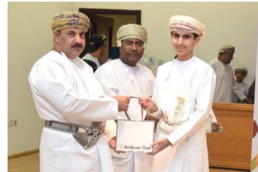
■ أثناء تكريم الطلاب وإدارات المدارس وأعضاء فريق المواطنة

مجموعة من المواضيع والقضايا المهمة في مجالات الاقتصاد والسياحة والبيئة والتراث المادي واللامادي والمجتمع المدرسي.. وغيرها، وتتلقت بيئة العمل بين البحر والرمل والمدينة، وتعددت وسائل البحث بين المقابلة والسؤال والتقصي والاستبانة، مع تفعيل التقنية الحديثة في التواصل مع الفئات المستهدفة من عينة الدراسة، ومشاركة واسعة من الأفراد والمؤسسات الحكومية والخاصة المتصلة بموضوع الدراسة، مما أسهم في تحقيق رؤية متكاملة لموضوع الدراسة قيد البحث، وحقق بالتالي تصورات ونتائج وتوصيات رائعة تم تطبيق بعض من مخرجاتها بشكل مباشر وتم رفع الجزء الآخر منها ليكون رافداً فكرياً للدارسين، أو قانوناً مقترحاً للمخططين أو مشروعاً متكاملًا للعاملين على التنفيذ في الجهات الحكومية أو الخاصة. ■