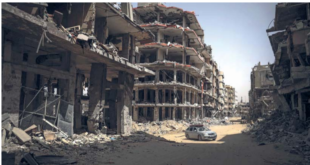
سيارة تسير على طريق تصطف على جانبيه المباني المدمرة في خان يونس جنوب غزة

بيونغ يانغ. أ.ف.ب. غادر وفد اقتصادي كوري شمالي بيونغ يانغ متوجهاً إلى إيران، حسبما ذكرت وكالة الأنباء الرسمية للدولة النووية، في زيارة نادرة قال محللون إنها تثير مخاوف بشأن التعاون بين البلدين. وقالت وكالة الأنباء المركزية الكورية في رسالة من جملة واحدة إن الوفد برئاسة وزير العلاقات الاقتصادية الخارجية يون جونج هو، توجه إلى إيران الاثنين، من دون ذكر أي تفاصيل. وتأتي الزيارة بعدما عززت بيونغ يانغ علاقاتها العسكرية مع موسكو في الأشهر الأخيرة.