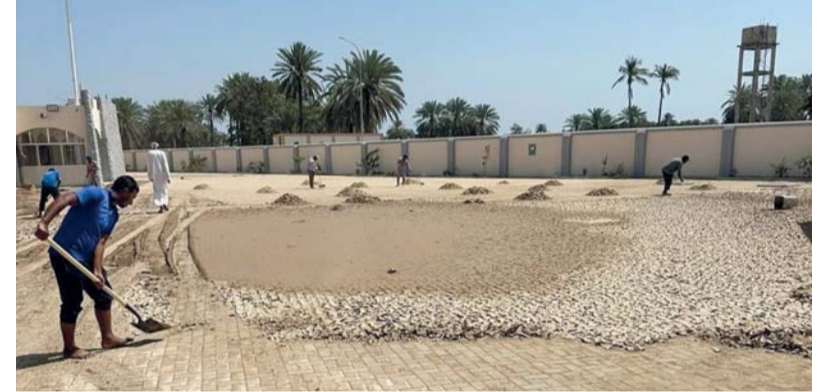
■ تأهيل المدارس المتأثرة بالحالة الجوية في شمال الباطنة