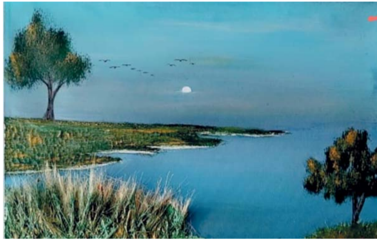
■ العمل بريشة التشكيلية جمانة الجساسية