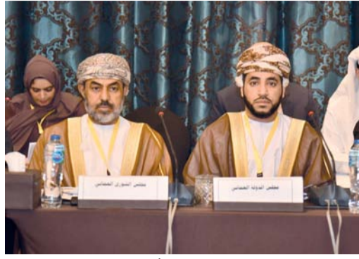
■ أثناء مشاركة وفد سلطنة عُمان في أعمال المؤتمر

الحراسي عضو المجلس في اجتماع اللجنة التحضيرية التي عقدت صباح أمس «الأربعاء» في القاهرة وتستمر على مدار يومين. ويتأسس وفد مجلس عمان المشارك في أعمال المؤتمر والاجتماعات التحضيرية وسعادة خالد بن هلال المعولي رئيس مجلس الشورى، ويمتثلون كل من المكرم سالم بن مسلم قطن، نائب رئيس مجلس الدولة، والمكرمة الدكتورة سناء بنت سبيل البلوشية، والمكرمة الدكتورة محمد بن سليمان الراشدي، أعضاء مجلس الدولة، وسعادة حميد بن جمعة