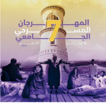
■ ملصق المهرجان

لاحتضان حفل الافتتاح والفعاليات والعروض والتحفيزات الخاصة بفعاليات المهرجان، فيما سيكون حفل الختام وتوزيع الجوائز يوم الخميس القادم بمسرح قاعة الشرقية، فيما تم تخصيص قاعة صور للجلسات النقدية وإقامة ورش العمل والمحاضرات، ويقدم المهرجان ضمن فعالياته حلقات عمل وندوات ومحاضرات في مجالات الفنون المسرحية بمشاركة عدد من المتخصصين في الإخراج المسرحي من الجمعية العمومية للمسرح، إضافة إلى طرح أهم الموضوعات التي تحافظ على ديمومة هذا الفن الذي يحتزل أهدافا كبرى في طرح ومعالجة قضايا المجتمع المختلفة.