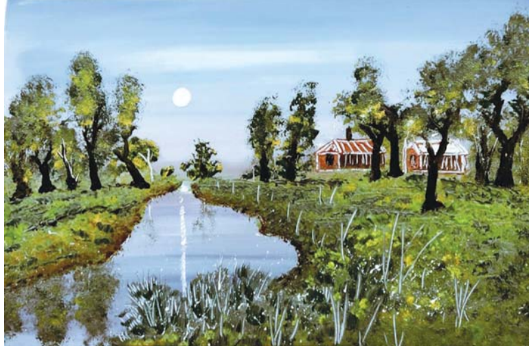
■ العمل بريشة الفنان التشكيلي جمال الجساسي