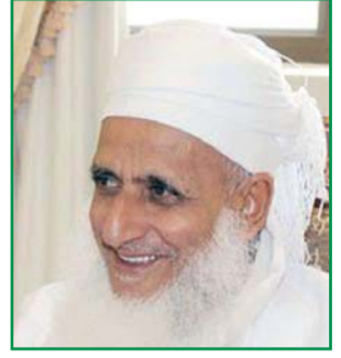
يجيب عن أسئلتكم سماحة الشيخ العلامة أحمد بن حمد الخليلي المفتي العام للسلطنة