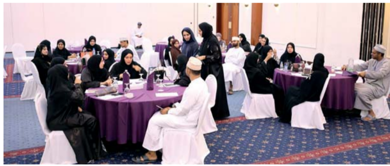
■ الحلقة استهدفت ٧٠ مشاركاً من الطواقم التمريضية للصحة المدرسية