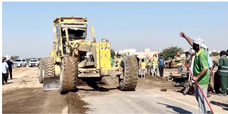
■ إعادة فتح الطرق في البريمي