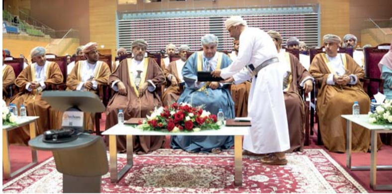
محافظ ظفار يداشن دائرة الملكية الفكرية والنسخة العمانية لدورة التعلم DL101

تحسين الظروف الاجتماعية والاقتصادية والتنمية المستدامة. وأضاف سعادته: تعتبر المؤشرات الجغرافية رصيد إستراتيجي للدول حيث إن حماية المؤشرات الجغرافية يساهم في تسهيل الحفاظ على سمعة المنتجات القائمة على المنشأ الجغرافي كما أن لها أهمية كبيرة في عدة جوانب منها الاجتماعية والتي تكمن في رفع مستوى المعيشي للأفراد المنتجين مما يشجعهم على زيادة الإنتاج وحصولهم على مردود مالي وتضيف ميزة تنافسية لهذه المنتجات. حيث أن انتشار سمعة منتج ما لا يتصف به من جودة تميزه عن غيره من العوامل التي تعزز وتضيف قيمة لهذه المنتجات وترغب بها مما يساهم في تسويقها داخليا وخارجيا والذي بدوره يوجد مورد للدولة وللمنتجين.