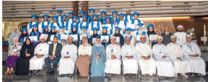
صورة جماعية للخريجين والمسؤولين في البنك الوطني العماني

الركائز المحورية التي تستند عليها استراتيجيتنا نحو الموظفين والتي تهدف إلى بناء كوكبة مستدامة من القيادات الشابة لقيادة البنك نحو تحقيق النجاحات المرجوة على المدى البعيد، إذ لا تقتصر مساعيها عبر هذه المبادرة على الاستثمار في النمو المهني لموظفينا فقط، بل نسعى أيضا إلى الاستثمار في نمو البنك ككل، ومن خلال تزويد موظفينا المهوبين بجملة من المهارات والمعارف القيادية اللازمة