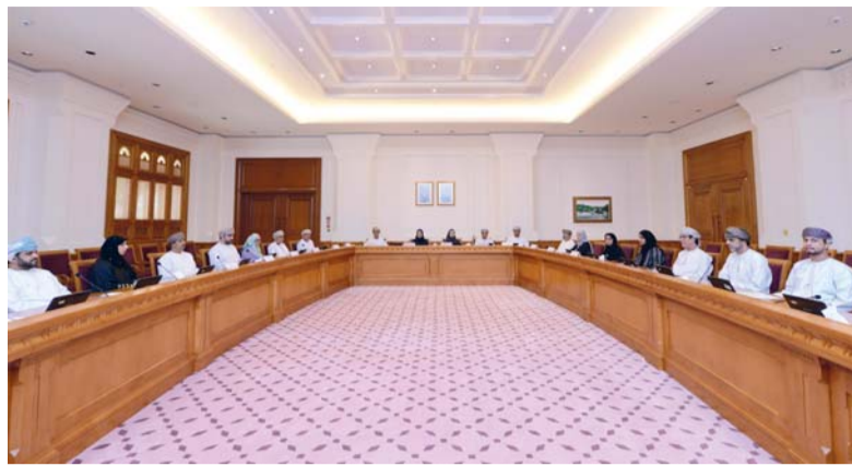
■ أثناء اجتماع اللجنة الفرعية لحقوق الطفل بمجلس الدولة

استضافت اللجنة الفرعية المنبثقة من اللجنة الاجتماعية والثقافية بمجلس الدولة والمشكلة بمناقشة «الملاحظات والتوصيات الختامية بالتقرير الوطني الجامع للتقاريرين الدوريين الخامس والسادس لاتفاقية حقوق الطفل، برئاسة المكرمة الدكتور عهود بنت سعيد البلوشية رئيسة اللجنة، وبحضور المُرَّمين أعضاء اللجنة، وعدد من موظفي الأمانة العامة، أمس، عدداً من مسؤولي وزارة التنمية الاجتماعية، واللجنة العمانية لحقوق الإنسان، وعدداً من مؤسسات المجتمع المدني؛ وذلك لإثراء الموضوع بمبريات المختصين والمهتمين. ناقشت اللجنة خلال اجتماعها الرابع لدور