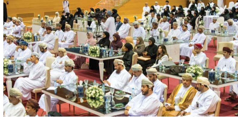
اليوم العالمي للملكية الفكرية يساهم في تعريف الجمهور بأهمية حقوق الملكية الفكرية

باليوم العالمي للملكية الفكرية يساهم في تعريف الجمهور بأهمية حقوق الملكية الفكرية وتكون المجتمعات على دراية جيدة بها وتشجيع احترام حقوق الملكية الفكرية، حيث أن جوانب الملكية الفكرية تعتبر ركائز مهمة في تطوير المجتمعات بما تشمله من براءات الاختراع والرسوم والنماذج الصناعية وحقوق المؤلف