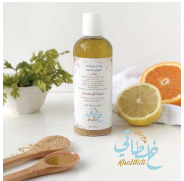
سلطنة عمان وتوجت بالشهرة.

وتم فتح ستة فروع موزعة على ولايات سلطنة عمان، وتحديداً في (إعلان بني بوعلی، صحرار، البريمي، العامرات، السيب وصلالة) ولدينا أيضاً أكثر من ٢٠ فرعاً، وحالياً تم إتاحة الطلب لكل دول العالم لكثرة الطلب من الخارج. حيث إن المصداقية والشفافية والمأمونية العالية في صنع المنتجات ولدت الثقة بيننا وبين المستهلك، وتقوم الشركة بتقديم الاستشارات المجانية والمتابعة المستمرة أيضاً لمستهلكي منتجات خلطاتي. المنتج الذي صنع يدوياً بأيدي (بنت السلطنة) عزيزة الخصبية التي صنعت منتجات فارقة، وقصة ملهمة للنجاح والإصرار والثبات في القمة على مستوى السلطنة ودول الخليج. ■