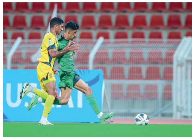
حلم النهضة تبخر أمام طموحات العهد اللبناني بعد أداء غير متوقع

وسط ذهول كبير، وحزن خيم على الوسط الرياضي بالسلطنة، وبأداء غير متقن، وبأخطاء فنية فادحة، فشلت النهضة في تحقيق حلمه بالوصول لنهائي كأس الاتحاد الآسيوي، حيث أنهى مواجهته الحاسمة في إياب نهائي غرب آسيا بالتعادل ٢/٢ أمام العهد اللبناني بمجمع السلطان قابوس الرياضي بوشهر، وهي المباراة التي توقع لها الكثيرون بأنها تكون بوابة العبور للأخضر الراقي للمباراة النهائية، والتي ستكون بمثابة حلم النهضة الذي سبق وأن ضاع منهم في ٢٠٠٨ بمجمع نزوى أمام المحرق البحريني آنذاك، إلا أن كل الجوانب المعدة لهذه الاحتفالية من قبل مجلس إدارة النادي برئاسة الشيخ أحمد بن ناصر النعيمي تبخرت تمامًا، وأصبح النهضة خارج المسابقة بعد أن كان يمني النفس بأن يحقق لقب البطولة أسوة بنادي السيب وأن تبقى في السلطنة للمرة