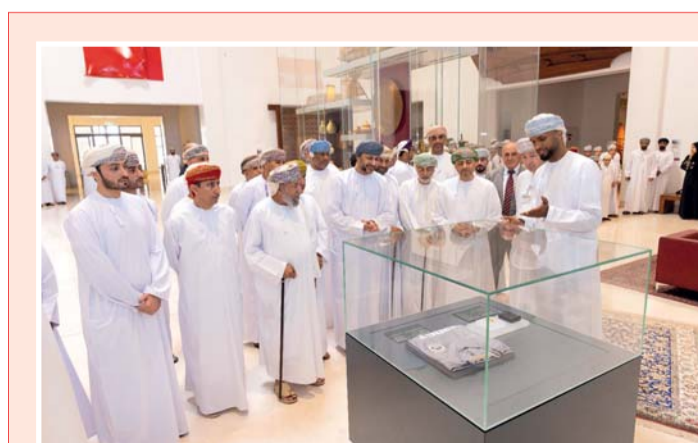
الحبسي يشرح إحدى المقتنيات

وسط ذهول كبير، وحزن خيم على الوسط الرياضي بالسلطنة، وبأداء غير متقن، وبأخطاء فنية فادحة، فشلت النهضة في تحقيق حلمه بالوصول لنهائي كأس الاتحاد الآسيوي، حيث أنهى مواجهته الحاسمة في إياب نهائي غرب آسيا بالتعادل ٢/٢ أمام العهد اللبناني بمجمع السلطان قابوس الرياضي بوشهر، وهي المباراة التي توقع لها الكثيرون بأنها تكون بوابة العبور للأخضر الراقي للمباراة النهائية، والتي ستكون بمثابة حلم النهضة الذي سبق وأن ضاع منهم في ٢٠٠٨ بمجمع نزوى أمام المحرق البحريني آنذاك، إلا أن كل الجوانب المعدة لهذه الاحتفالية من قبل مجلس إدارة النادي برئاسة الشيخ أحمد بن ناصر النعيمي تبخرت تمامًا، وأصبح النهضة خارج المسابقة بعد أن كان يمني النفس بأن يحقق لقب البطولة أسوة بنادي السيب وأن تبقى في السلطنة للمرة