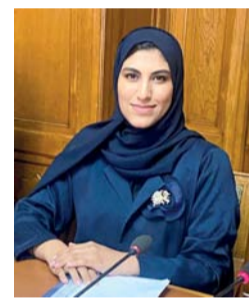
■ أسماء العدوية

لقرار مجلس وزراء العدل العرب رقم (١٣١٢) الصادر عن دورته الـ ٣٩ المنعقدة في أكتوبر من العام الماضي إلى دراسة مشروع القانون في ضوء ملاحظات ومبررات الدول العربية عليه، وعرض نتائج أعمال اللجنة في الاجتماع القادم للمكتب التنفيذي لمجلس وزراء العدل العرب تمهيداً لرفعه للدورة القادمة للمجلس. ويعد مشروع القانون من الموضوعات المشتركة بين